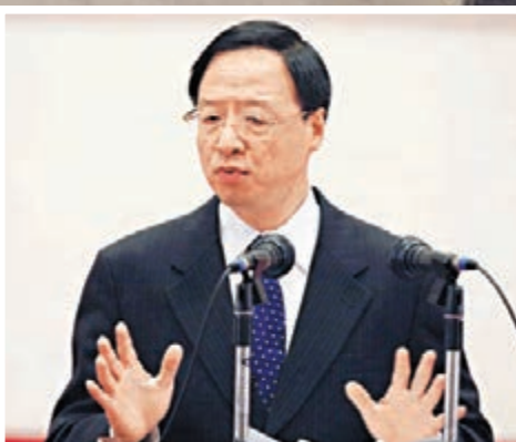
江宜樺昨日表示，罷工、罷市嚴重干擾經濟活動，呼籲各界理性、冷靜。