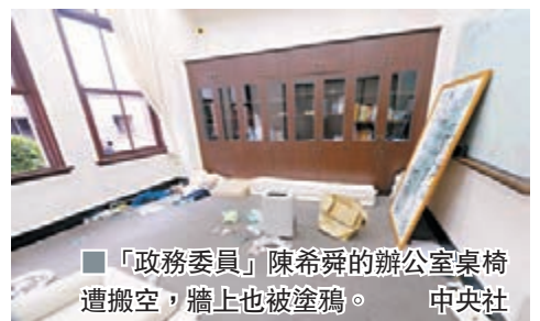
「政務委員」陳希舜的辦公室桌椅遭搬空，牆上也被塗鴉。

300萬元新台幣，其餘仍在陸續統計中。不少一早上班的公務員，進到辦公室後發現一片狼藉，包括電話線、電腦線等遭到破壞，甚至私人物品都遭到亂翻亂丟，還有人留字條「可以感冒，不要服貿」，當場令他們傻眼，氣到說不出話，痛批「這些不是暴民，是什麼？」