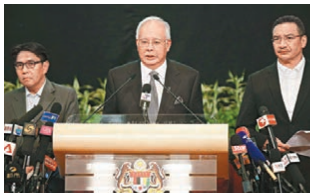
■昨晚，馬來西亞總理納吉布(中)召開記者會，稱相信馬航客機已於南印度洋墜毀。

香港文匯報訊 綜合報道，馬航MH370班機失蹤第17天後，馬來西亞總理納吉布昨晚10時終於宣佈，根據最新信息，失聯的MH370客機已於澳洲珀斯以西的南印度洋海域墜毀，機上無人倖存。馬航將安排中國乘客家屬乘包機前往澳洲珀斯善後。在簡短的發布會上，納吉布並無接受記者提問，也未透露飛機墜毀的具體資料，只表示會在25日舉行發布會上公佈更多細節。中國外交部發言人洪磊表示，中方要求馬方提供客機墜海的所有信息和證據。