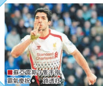
蘇亞雷斯3隻手指霸氣慶祝。路透社