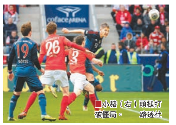
小豬(右)頭槌打破僵局。