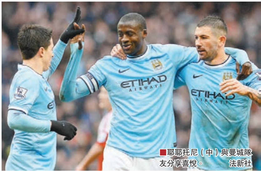
耶耶托尼(中)與曼城隊友分享喜悅。