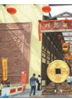
西安大唐西市絲綢之路風情街再現了古絲綢之路的貿易盛況。

隨着去年底「長安號」國際貨運班列的成功運行，貨物運往中亞的時間和資金成本均大幅下降。目前，「長安號」搭載的貨物產地主要來自陝西、江蘇、河北和山東等地，首班列出口總值共計達221萬美元（約1723.8萬港元）。