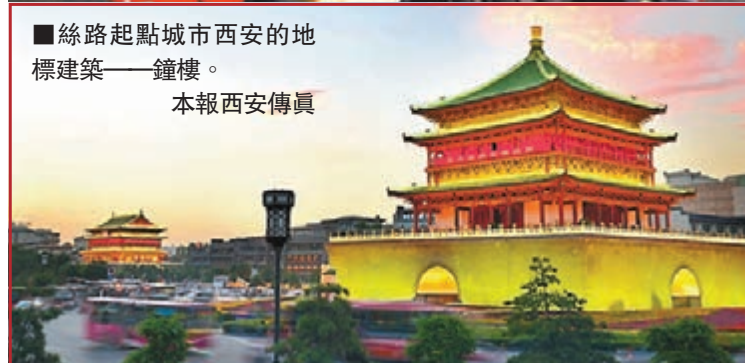
絲路起點城市西安的地標建築——鐘樓。本報西安傳真