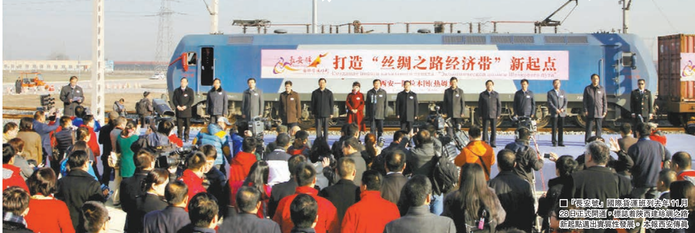
「長安號」國際貨運班列去年11月28日正式開通，標誌着陝西建絲綢之路新起點邁出實質性發展。本報西安傳真