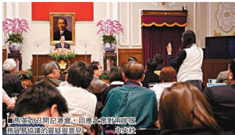
馬英九召開記者會，回應大眾對兩岸服務貿易協議的質疑與意見。