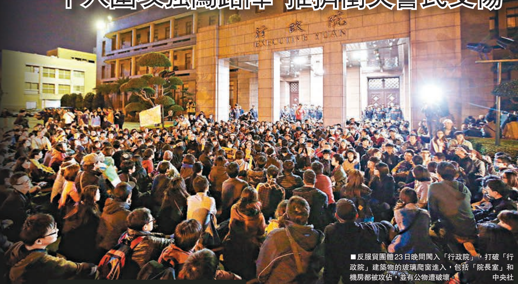
反服貿團體23日晚間闖入「行政院」，打破「行政院」建築物的玻璃爬窗進入，包括「院長室」和機房都被攻佔，並有公物遭破壞。 中央社

香港文匯報訊 綜合消息：台灣親綠團體及部分學生強佔「立法院」至今進入第7日，台灣當局領導人馬英九昨日在「總統府」舉行記者會，隔空回應學生訴求，強調兩岸服務貿易協議是為了台灣的未來，應逐條審查、逐條表決；而民主法治得來不易，不要輕易毀棄，呼籲學生早日撤離，讓「立法院」恢復正常運作。不過，學生團體並不接納，更升級行動，昨晚上千人闖入「行政院」，又呼籲全民加入、全台高中及大學生全面停課。有大學學系響應停課，但校方表明雖不制止，也不鼓勵。