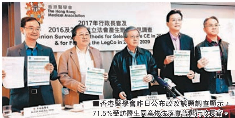
香港醫學會昨日公布政改議題調查顯示，71.5%受訪醫生同意依法落實普選行政長官。

香港文匯報訊(記者 鄭治祖) 香港各界普遍支持2017年能如期依法落實特首普選，香港醫學會昨日發表的調查就發現，逾七成(71.5%)受訪醫生表示同意根據《基本法》及全國人大常委有關規定普選行政長官。調查更指出，逾半醫學界(54.6%)反對違法的「佔中」行動，僅有不足三成(24.6%)表示支持。調查結果發現，受訪者對直接「公民提名」意見紛紜，香港醫學會會長謝鴻興估計是因為政改諮詢剛開始時，「三人小組」未有清楚解釋「公民提名」有否違反《基本法》，希望未來有更多清晰的解釋。