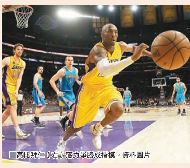
■高比拜仁(右)落力爭勝成楷模。

專門敲定一個「歡送賽季」，不僅湖人要感謝高比拜仁的貢獻，全聯盟其他 29 支球隊也應該向高比拜仁致敬。