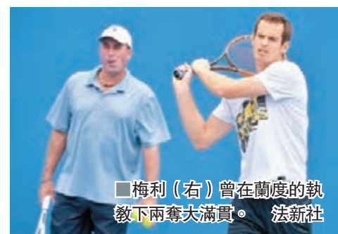
■梅利(右)曾在蘭度的執教下兩奪大滿貫。