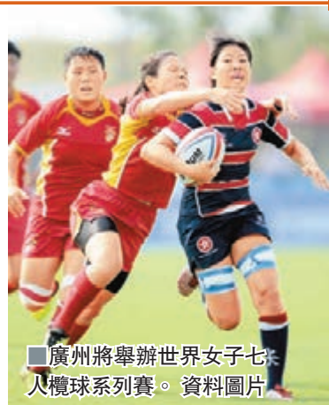
■廣州將舉辦世界女子七人制欖球系列賽。資料圖片

廣州站作為本賽季第四站賽事，將有全球 12 支頂尖隊伍參與角逐，約有 250 名運動員、裁判員和官員參與，其中包括澳大利亞、加拿大、英格蘭等 8 支頂級隊伍和中國、法國等 4 支邀請隊伍。