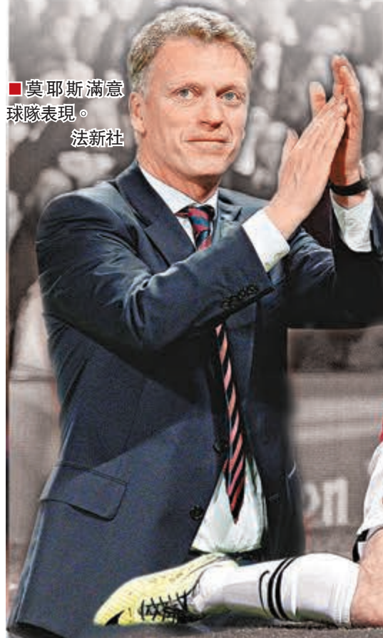
■莫耶斯滿意球隊表現。

曼聯能逆轉晉級歐聯8強，比賽中，除了完成帽子戲法的荷蘭前鋒尹佩斯外，曼聯門線上的西班牙門將迪基亞高接低擋，幫助球隊零封對手，也是球隊晉級的功臣之一。 縱觀整場比賽，曼聯雖然最終完勝奧林比亞高斯，但過程卻並不輕鬆，因為一旦讓對方攻入一球，曼聯就必須攻入4球才能夠晉級。這也就意味着，這場比賽對於迪基亞來說，是一場不容出現一絲錯誤的比賽。 對手奧林比亞高斯今仗攻勢不少，他們全場有13腳射門，有4次擊中門框範圍以內，而這4次射門均被西班牙門將迪基亞一一化解。 尤其是在上半場40分鐘左右的時候，當時僅僅以1:0領先的曼聯遭到了對手的反擊，奧林比亞高斯射手富斯達在距離球門很近的地方頭球攻門，被迪基亞擋出後，艾真度杜明基斯迅速插上補射，反應神速的迪基亞用腳將皮球擋出。而如果此次沒有迪基亞的神級表現，曼聯恐怕今仗入了3球也是徒然。 ■香港文匯報記者 梁啟剛