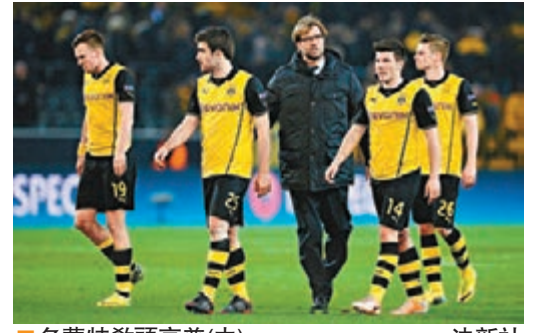
■多蒙特教頭高普(中)。

昨日另外一場歐聯16強次回合比賽中，德甲多蒙特在主场以1:2不敵俄羅斯球會辛尼特，但仍以5:4的總比分晉級8強。 辛尼特一開賽就主動搶攻，在16分鐘，由侯克一記遠射領先。但多蒙特到完半場前，隊長基爾應接舒姆沙的傳中頂入，追成1:1，保持總比數領先2球的優勢。辛尼特到下半場73分鐘，由荷西朗頓射成2:1，出線仍有一線希望，球隊之後繼續狂攻，但未再取得入球，多蒙特主场輸球，但仍晉級。 多蒙特教練高普賽後說：「所有球壇中人都知道，辛尼特不容易應付，對方是歐洲足壇的精英分子，現在我們期待8強賽事。」值得一提的是，多蒙特射手利雲度夫斯基今仗在比賽領黃牌後，8強首回合須停賽，對球隊有一定影響。 辛尼特暫代教練施馬克賽後就表示，球隊表現最佳，「要入3球反勝是艱巨任務，很不幸，我們未能做到。己隊有很好的表現，值得嘉許，球員已盡力做到最好了。」 ■香港文匯報記者 梁啟剛