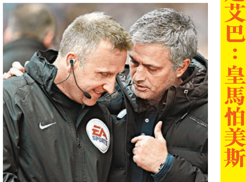
■摩連奴(右)被指行為不當。

新華社倫敦19日電 15日車路士在英超客場爆冷負於阿士東維拉，主帥摩連奴在傷停補時階段因對球證判罰不滿被罰上看台。然而禍不單行，19日英足總宣佈對「狂人」的行為不當提出指控。 在比賽中，球證向車路士中場大將拉美利斯出示紅牌，摩連奴對此大為不滿衝入場內，也被「請」上看台。英足總聲稱：「車路士主帥摩連奴在比賽中衝入場地質問球證，這一舉動將被指控為行為不當」。而摩連奴則需要在24日之前對此進行回應。 英足總規定，在比賽進行過程中，雙方教練不得離開指揮區域。然而，根據摩連奴的說法：「當時有不少人都離開指定區域衝入場內」。 「我當時在場內距離邊線2到3米或是4到5米，不過有10個人在那裡。包括我和我的兩位助手以及林拔(阿士東維拉主帥)和他的助手，」摩連奴說：「艾邦拉賀(阿士東維拉球員)也衝入場內對拉美利斯進行了責罵，如果因為衝入場地而被罰上看台，那麼其他人呢？艾邦拉賀呢？」 摩連奴表示，他曾在場地內和更衣室兩度試圖與球證進行交流；「狂人」說：「在更衣室，我很禮貌地對球證說『你能給我5秒的時間嗎？』，不料他卻拒絕了。」 這是本賽季摩連奴第2次被罰上看台，去年10月與卡迪夫城的比賽中，摩連奴同樣被驅逐出場，並被罰款8000歐元。