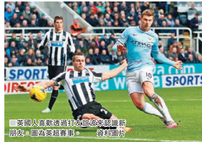
英國人喜歡透過打友誼波來認識新朋友。圖為英超賽事。

未幾，筆者控球在腳，眼角見到肥仔在龍門前，於是大腳一抽，將球交到肥仔腳下。肥仔控球後，一個富利(volley)再射破對方的龍門，領先2比0。肥仔即時衝過來，大力又熱情地擁抱筆者，更轉了兩個圈，感謝筆者傳中助攻。大家