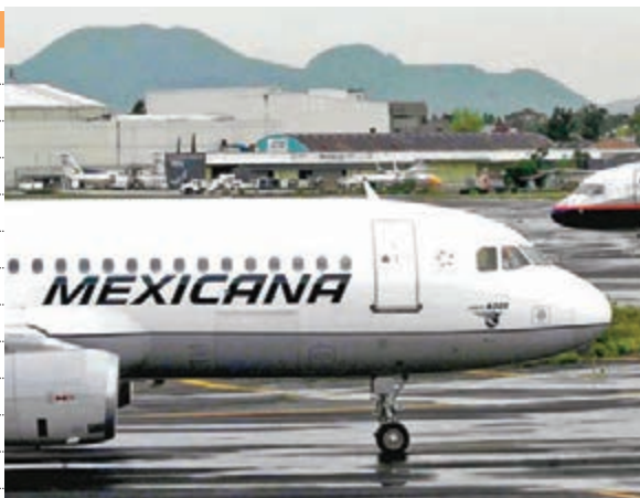
Taxi作動詞用時，解「滑行」。圖為飛機滑行。資料圖片