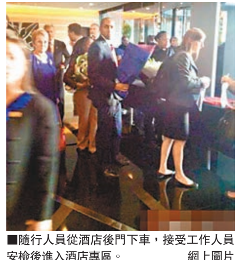
隨行人員從酒店後門下車，接受工作人員安檢後進入酒店專區。

3月20日：米歇爾攜兩位女兒和母親抵達北京。 3月21日：彭麗媛將陪同米歇爾走訪一所中學，強調教育的重要意義，隨後陪同米歇爾參觀故宮。兩位夫人還會共進私人晚餐並觀看演出。 3月22日：米歇爾將在北京大學斯坦福中心發表演講，與中美留學生見面，探討留學議題以及科技在文化交流中發揮的重要作用。她還將參觀頤和園，並與美國駐華大使館工作人員見面。 3月23日：米歇爾將在北京舉辦教育圓桌會議並參觀長城。