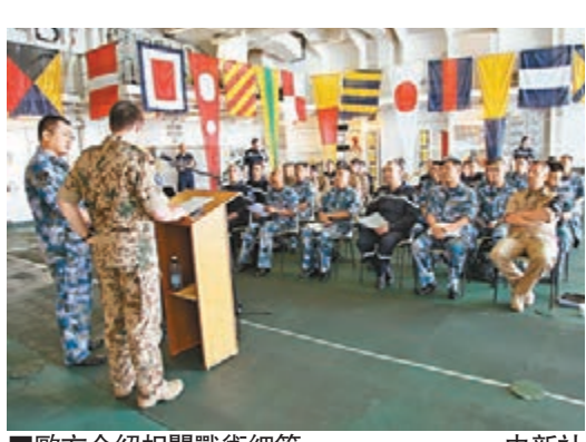
歐方介紹相關戰術細節。