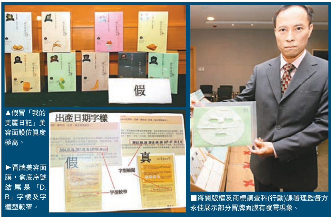
▲假冒「我的美麗日記」美容面膜仿真度極高。

海關於上周接獲市民投訴，指在尖沙咀一間藥房購買的美容面膜，與過往慣用的無論味道及質感都有異，疑有人出售冒牌貨。海關版權及商標調查科於是突擊搜查該藥房，檢獲245盒價值1.27萬元的懷疑冒牌美容面膜，拘捕2名店東及1名售貨員。隨後根據線索先後搜查上水及大埔2個貨倉，共檢獲同類懷疑冒牌面膜4,504盒，拘捕3人。另外又搜查元朗2間目標藥房，再檢獲同類懷疑冒牌面膜370盒，拘捕6人包括店東及售貨員及採購員等。