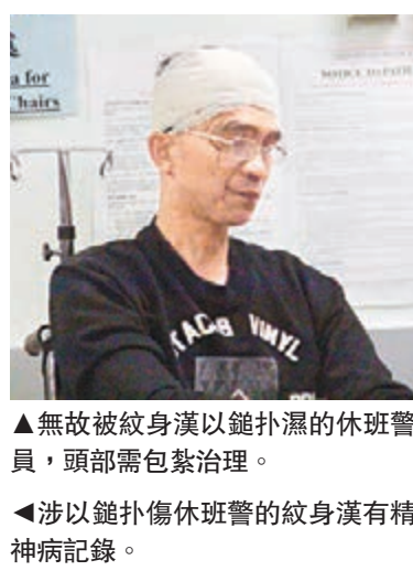
▲無故被紋身漢以鋸扑濕的休班警員，頭部需包紮治理。