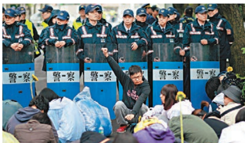
抗議民眾與配備盾牌的警察部隊。

江宜樺昨日表示，「立法院」已經舉行了十幾場公聽會，且相關部會積極與產業界溝通，反對者有關黑箱作業的疑慮其實是不必要的。他強調，服貿協議不只利大於弊，而且攸關台灣未來經濟發展，這會期仍須把服貿的推動當成各部會的重要責任。