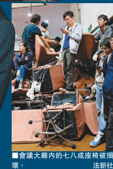
會議大廳內的七八成座椅被損壞。