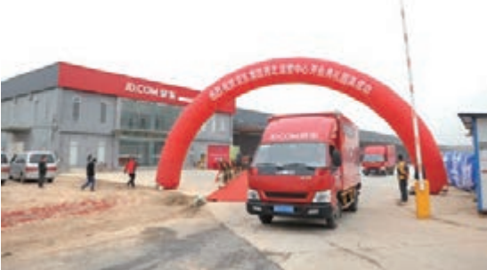
■京東集團西北運營中心基地。

目前，京東集團西北運營中心擁有中小件綜合倉1個，大貨倉2個，總倉儲面積達到5萬平米，倉儲配送人員近600人，輻射陝西、寧夏、青海、新疆、甘肅等地區。京東集團西北分公司總