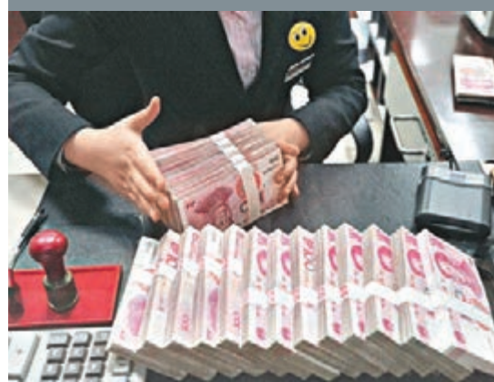
新增外匯佔款跌至五個月新低,超出市場預期。 資料圖片

香港文匯報訊 內地2月新增外匯佔款較前月大幅減少,跌至五個月新低,亦低於市場預期。這個數字令分析師相信,此前人民幣匯率的貶值更可能是市場供求關係造成,而非央行刻意壓低。