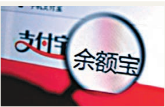
餘額寶的規模已突破5,000億元。

雖然近日已公布業績的內房企大多錄得盈利增長,並上調今年全年目標,但上述事件凸顯,內房企高速運轉的資金鏈一旦斷裂,情況將會很糟糕。