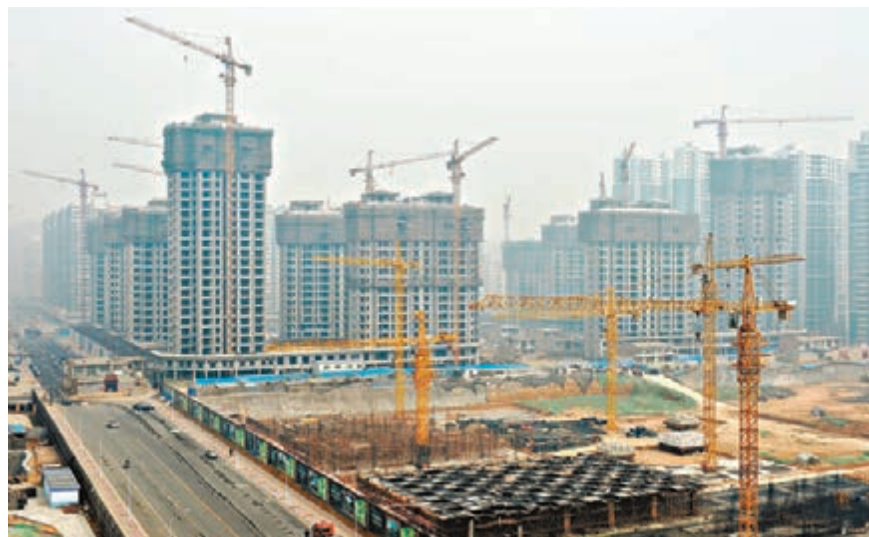
合約銷售額萎縮表明,受到信貸緊縮影響,中國三四線城市正展現疲弱態勢,澳新銀行對地產債券的短期走勢持謹慎態度。 新華社

另據彭博社報道,隨着興潤置業場場的資不抵債及內地房地產市場降溫,約66%房地產開發商今年新發行美元計價債券在二級市場上的價格低於發行價。據彭博匯總數據,富力地產、合景泰富和世茂房地產等發行的約63億美元美元計價債券在二級市場交易中下挫。佳兆業於2018年到期、票面利率為8.875%