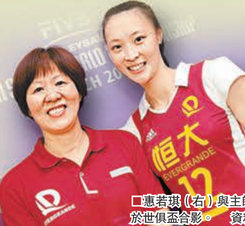
■惠若琪(右)與主帥郎平於世俱盃合影。 資料圖片