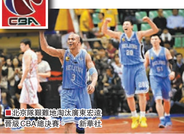
■北京隊艱難地淘汰廣東宏遠晉級CBA總決賽。

新華社北京18日電 2013-2014賽季CBA聯賽(中國男籃職業聯賽)總決賽將於19日點燃戰火，時隔一年重