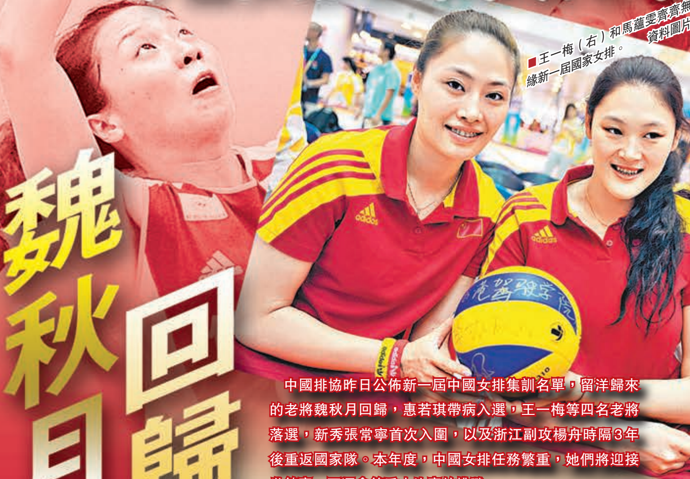
■王一梅(右)和馬蘊雯齊集新一屆國家女排。 資料圖片