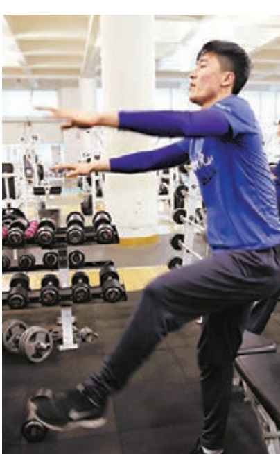
■正在康復訓練的劉翔入選青奧會榜樣人物。 資料圖片

此外，借助國際奧委會的數字平台及社交媒體渠道等途徑，世界各地關注青奧會的人都能夠與這些榜樣人物進行互動。