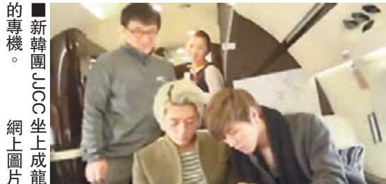
新韓團JJCC坐上成龍的專機。

全世界粉絲也將一起為大哥慶生，成龍透露在房祖名的提議下，他自掏腰包邀請了來自52個地區的1000名影迷，到北京參加自己的演唱會，其間成龍還將帶領他們遊長城、吃烤鴨、參觀上海的成龍藝術館等。