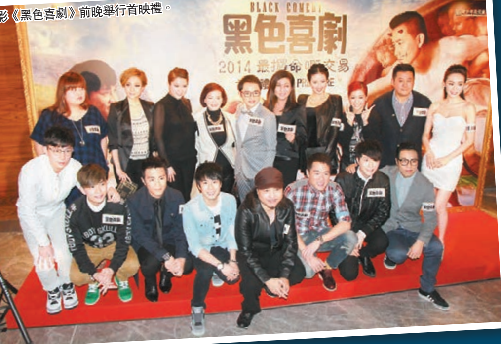
電影《黑色喜劇》前晚舉行首映禮。