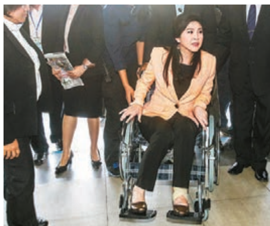
英祿的左腳踝明顯腫脹。