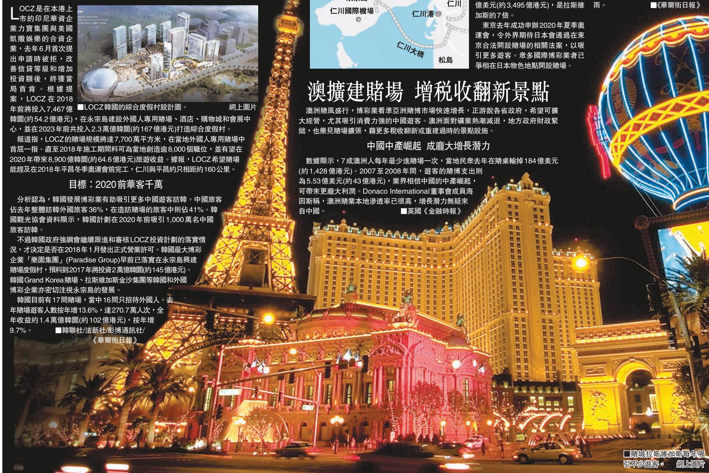
賭城拉斯維加斯每年吸引不少遊客。