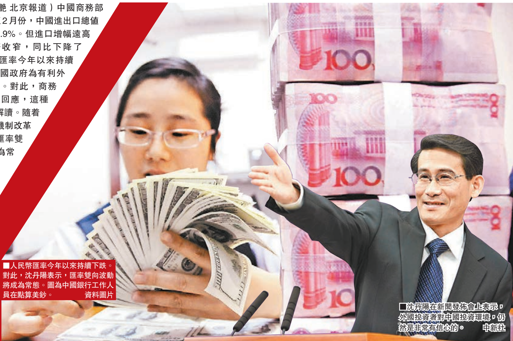
■人民幣匯率今年以來持續下跌。對此，沈丹陽表示，匯率雙向波動將成為常態。圖為中國銀行工作人員在點算美鈔。

沈丹陽在例行新聞發佈會上表示，今年前兩個月中國消費結構更趨合理，大眾化消費快速增長，居民消費更加理性，消費增長更加實在。