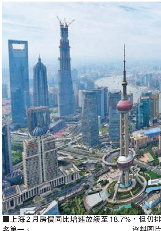
■上海2月房價同比增速放緩至18.7%，但仍排名第一。資料圖片