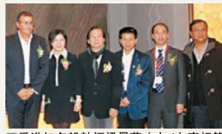
香港知名設計師梁景華（右4）亮相第14屆廈門國際石材展。

香港文匯報訊（記者 陳麗芳 廈門報導）曾被李嘉誠、林青霞等名流指定設計豪宅的香港傑出設計師梁景華首次獲邀，與廈門石材企業聯手合作打造內地首個SAG（Stone art gallery，石尚空間）模式，營建一個薈萃全球頂級石材的藝術殿堂「石尚空間」。