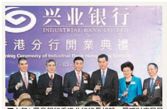
左起:興業銀行香港分行行長胡麟、署理財庫局局長劉怡翔、興業銀行董事長高建平、香港特首梁振英、中聯辦副主任殷曉靜、興業銀行行長李仁傑。

幣匯價尚算平穩,國指微升34點報9,333點。新世界(0017)受供股消息拖累,加上瑞信及瑞銀大幅調低其目標價,該股未止跌,昨日再跌5.6%,是今日表現最差藍籌。大市只剩濠賭股「撐場」,本周三發業績的銀娛(0027)獲大行唱好,全日漲4.36%,金沙(1928)亦升近2%。