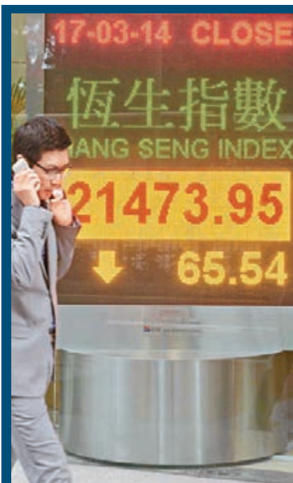
騰訊拖累,恒指昨再跌65點,成交大減至567億元。

另外,昨日軟件股跌幅較小,黃德几指,軟件股、網遊股皆有實質業務與利潤,故影響較輕,料金山由高位下調