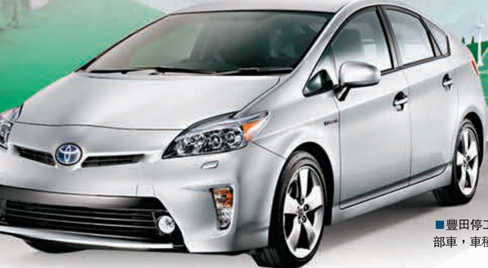
豐田停工廠房每年產能約31萬部車，車種包括Prius。

分析認為，日本核電業根深蒂固的多層招聘系統是最大禍因，一旦發生事故，東電會以此作為藉口開脫。有工人稱，中介公司並沒要求提供任何證明便聘請他，並坦言自己很多時都不知道在核站內是檢查甚麼。■《紐約時報》