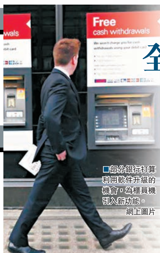
部分銀行打算利用軟件升級的機會，為櫃員機引入新功能。

XP。部分銀行則利用軟件升級的機會，為櫃員機引入新功能，如閱讀微型晶片，以取代舊有的磁帶辨識功能。擁有1.92萬部櫃員機的摩根大通，將於7月起升級至視窗7，預期於年底前完成。摩通希望藉此改善數據加密技術，確保櫃員機更新軟件時更具效率及減少離線時間。路透社引述知情人士指，曾發生連串電腦技術問題的蘇格蘭皇家銀行已和微軟達成協議，將公司9,000部櫃員機的支援服務延長3年，並於明年起升級至視窗7，估計需時3年。匯控則稱，早和微軟達成3年升級協議，升級過程料於明年完成。■路透社