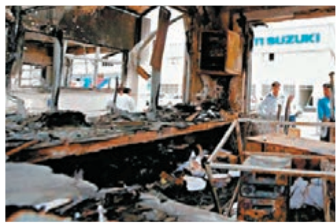
鈴木印度分公司前年發生工人暴動。