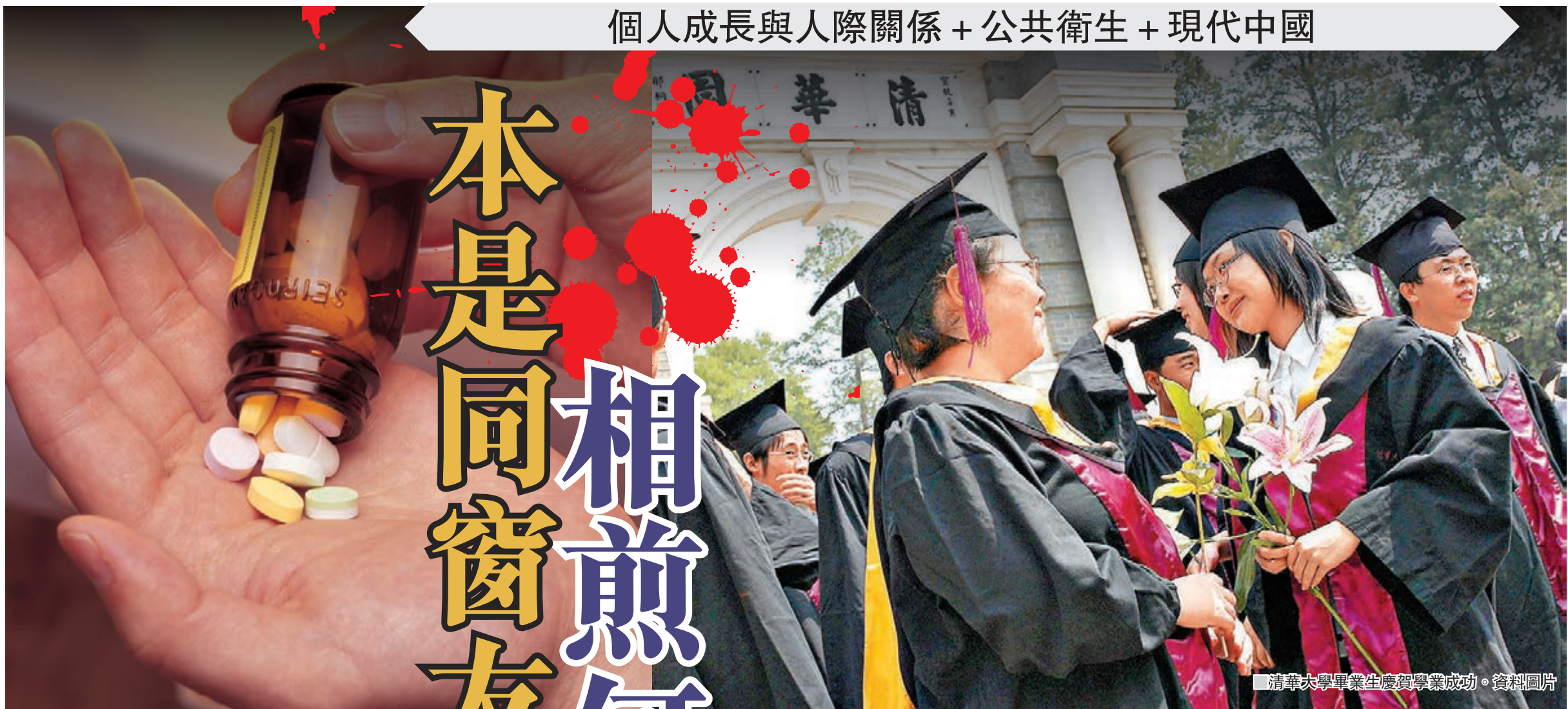
清華大學畢業生慶祝學業成功。資料圖片