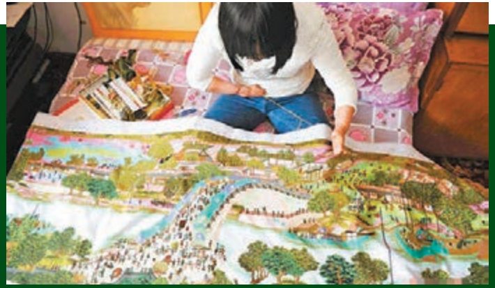
無指女掌繡清明上河圖 3月14日，吉林長春市民張宇飛在家中繡着《清明上河圖》，這幅作品她打算送給即將出嫁的外甥女。42歲的張宇飛因兒時家中一場火災造成雙手截肢，2009年，沒有十指的她學會了用手掌繡十字繡，幾年來共完成8幅繡品，最大一幅有2.5米長。 中新社

5年裡，宋青山一家替全村人交新合療的保費約有110萬元。「兄弟兩個都不算什麼大款，和他們父親一樣，心裡有一個『情』字。」村民說。宋興虎在辦完父母喪事後給全村人寫了一封感謝信：我們是喝寺溝水長大的，是寺溝人民哺育了我們，無論走到哪裡我們懷揣的都是熱愛寺溝的心。我們會繼承和發揚父母的優良品質和家風，在力所能及的情況下為家鄉人民盡一份綿薄之力，讓家鄉人民生活得更好一些。 ■《華商報》