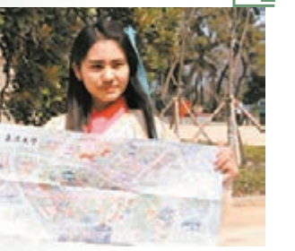
漢服靚女正在推銷地圖。

武漢大學賞櫻已成為當地一道風景線。近日，一冊配有原創詠櫻詩詞的手繪賞櫻地圖，在網上和高校熱銷，銷售額已近萬元。「珞珈心，櫻雨情。鬱鬱蒼林，老齋古生風……」地圖封