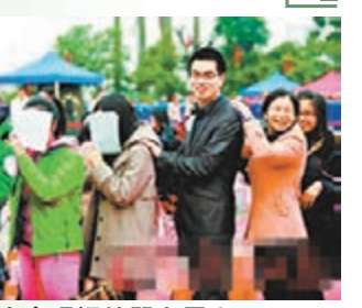
相親大會現場的單身男女。

近日，在廣州市南海神廟舉行的「遊波羅娶老婆」相親大會上，眾多大齡男女青年來此尋找自己的另一半，記者發現，前來相親的女青年數量略多於男青年，且大多顯得十分羞澀。有趣的是，相親大會現場居然出現50後和90