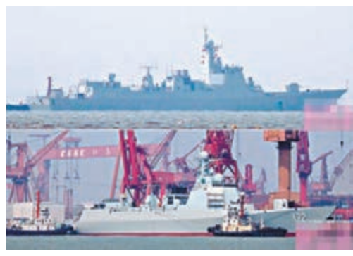
網傳疑似第2艘052D驅逐艦海試航圖片(上)，以及近日完成刷號的首艘052D172艦(下)。

052D驅逐艦採用了新型導彈垂直發射裝置，大型有源相控陣雷達等設備。新導彈垂直發射裝置可以容納大型武器，包括「東海-10」巡航導彈和「紅旗-9」遠程防空導彈等，導彈發射裝置的數量也從原來的48個改為64個，火力較052C得到極大增強。隨着越來越多的現代先進艦艇服役，中國海軍將從此擺脫近岸防禦的被動局面，走向深藍。