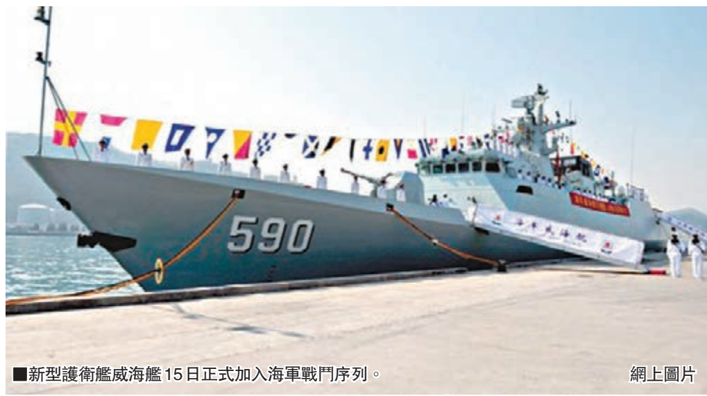
新型護衛艦威海艦15日正式加入海軍戰鬥序列。