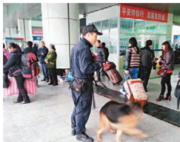
福州警方帶警犬巡邏火車站。

與之相比，解放軍個別單位在組織演習時，喜歡搞大場面、大製作，不是彩旗飄飄，就是口號陣陣。按說，一次演習結束後，得到最多的應該是與作戰有關的數據、教訓，而軍方留下最多的卻是演習腳本和一大堆錄