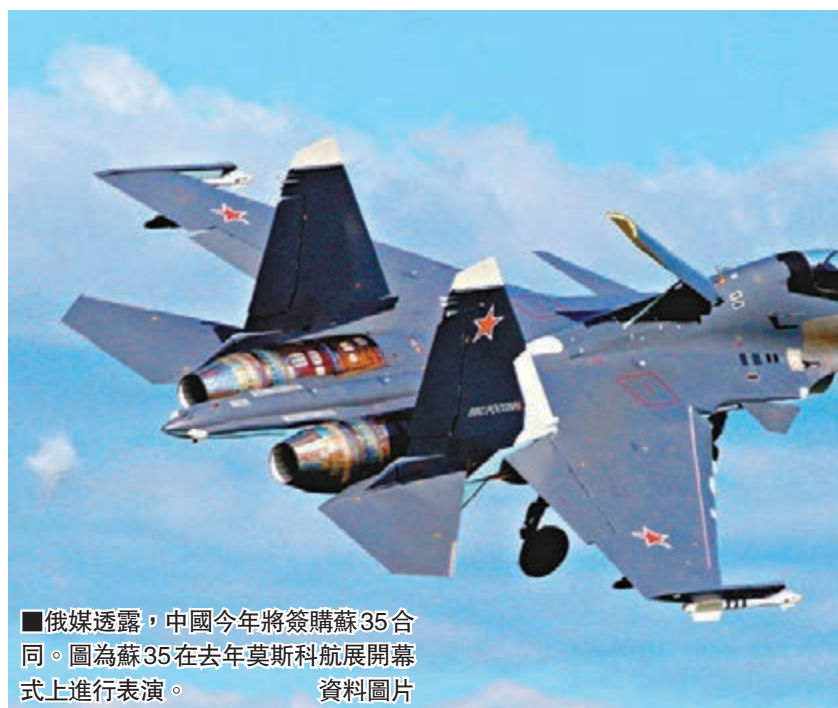
俄媒透露，中國今年將簽購蘇35合同。圖為蘇35在去年莫斯科航展開幕式上進行表演。資料圖片

香港文匯報訊 俄塔社軍事新聞分社報道，俄羅斯國防工業綜合體一名代表14日在莫斯科表示，俄羅斯和中國關於最新型多功能殲擊機蘇35供應的合同將在今年簽訂，可能採購12至24架蘇35殲擊機。