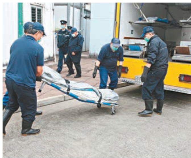
慘遭斬殺後燒屍的女死者遺體由件工昇走。