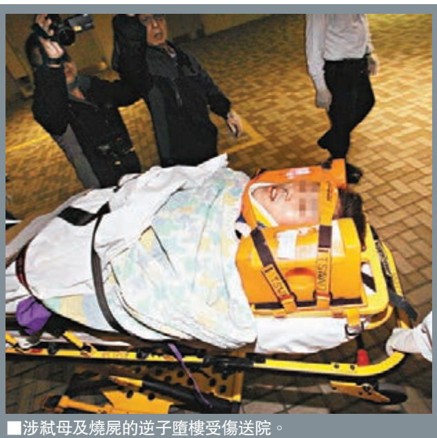
涉弑母及燒屍的逆子墮樓受傷送院。