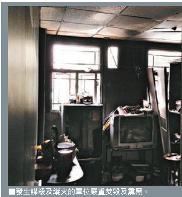
發生謀殺及縱火的單位嚴重焚毀及熏黑。