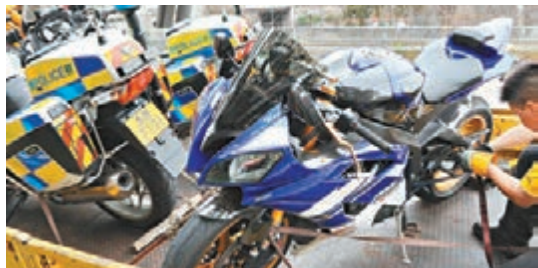
瘋狂駕駛男子所駕Yamaha R6電單車被連走待驗。左為2輛遭撞毀警方「鐵馬」。

香港文匯報訊(記者 杜法祖)愛駕大馬力電單車的機場男地勤,昨晨與車友到大帽山遊車河,在「英雄亭」拍照留念後回程時,疑因高速亂切線,涉違規被警方鐵馬截查,惟有人拒絕停車,更不斷加速逃走,至10公里外的元博愛交匯處,警方利用3輛鐵馬架設路障堵截,詎料有人仍不顧一切企圖衝越路障,惟最終失敗翻車就擒,疑人涉「瘋狂駕駛」及「駕駛時沒有第三者保險」遭扣查,事件中2輛警方鐵馬損毀,2名交通警腳部受傷需送院救治。