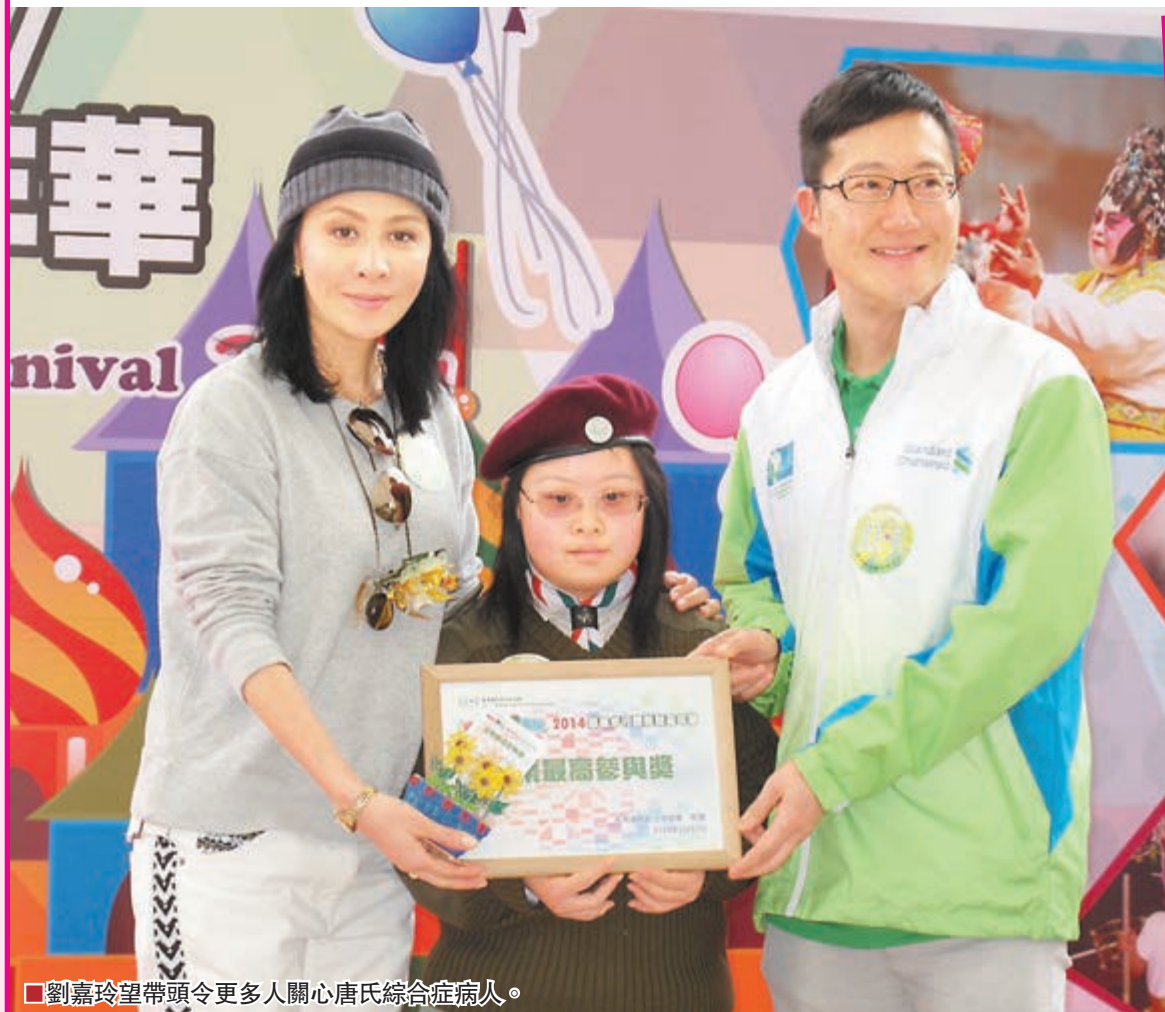
劉嘉玲望帶頭令更多人關心唐氏綜合症病人。