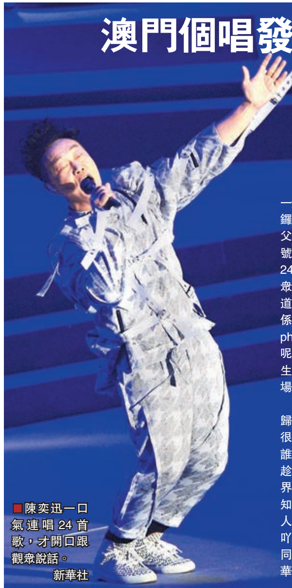
陳奕迅一口氣連唱24首歌，才開口跟觀眾說話。

香港文匯報訊 陳奕迅(Eason)一連兩場巡迴演唱會澳門站前晚開鑼，太太徐濠縈、女兒陳康堤及陳父陳裘大現身捧場。有「吹神」稱號的Eason，前晚竟然一口氣連唱24首歌始開口跟觀眾說話，問觀眾：「啲聲得唔得？」台下觀眾答道說好，Eason卻無奈說：「原來係得我一個唔好聲！因為我個earphone，個earphone啲聲大到呢，我個耳管特別敏感，我仲俾生，可能有啲人越來越唔得。」現場工作人員即時幫佢調整耳機。