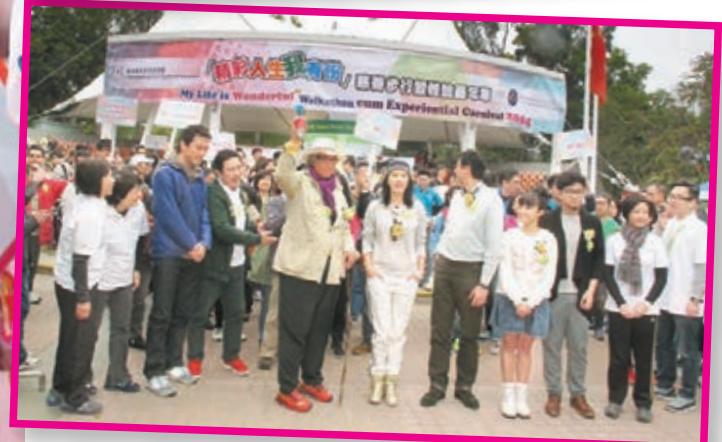
劉嘉玲與糖兄妹出席慈善步行籌款活動。