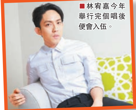
林宥嘉今年舉行完個唱後便會入伍。

宥嘉也透露會演唱其他歌手的歌，他說：「有蠻多大家以前沒有聽過我唱的歌，但我自己聽演唱會我喜歡和台上的人一齊唱歌，這次有準備一些曲目讓大家都和我一齊唱。」宥嘉最近喜歡陳綺貞的《小