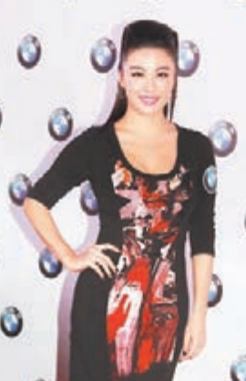
廖碧兒望藝人能有更多平台亮相。