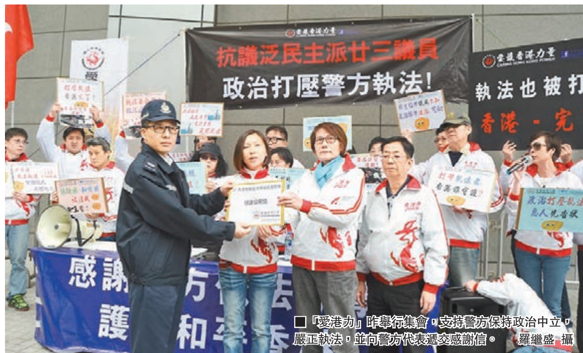
「愛港力」昨舉行集會，支持警方保持政治中立，嚴正執法，並向警方代表遞交感謝信。

他又提到，民主黨近年亦有不少黨員涉及桃色醜聞，前民主黨主席兼立法會議員何俊仁在財政司司長曾俊華宣讀預算案期間，公然瀏覽醜聞，現在許智峯又再「無賴碌地沙」，直斥民主黨「大事做不了，小動作多多」。