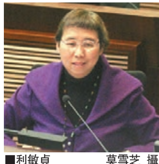
利敏貞 莫雪芝 攝