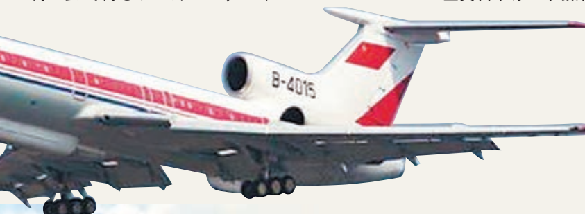
圖-154是一款前蘇聯的中程客機，於1968年首次試飛，至今仍有500多架在飛行。該機優勢是結構穩固、推重比好，而且不挑機場，能從凹凸不平甚至積雪的場面起降。 其近百噸的起飛重量、較大的內部空間和6,000公里的航程，非常適合加載大型機載電子設備，改裝用作大型電子偵察飛機。 圖-154的最大載重量可達18噸，最大航程超6,000公里，噸位大則可攜帶更多的電子設備，航程遠則能延長在空中的滯留時間。 另外，該機利用機載合成孔徑雷達和實時成像系統，全天候地獲取地面信息，性能非常先進。