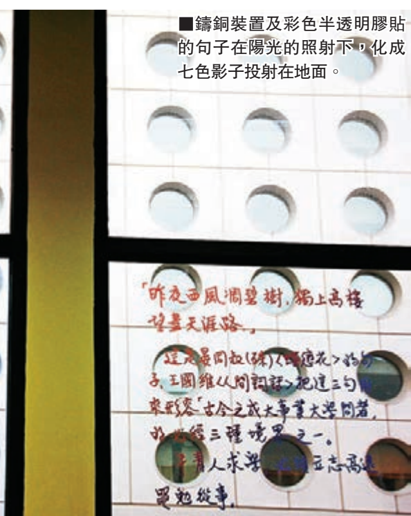
鑄銅裝置及彩色半透明膠貼的句子在陽光的照射下，化成七色影子投射在地面。