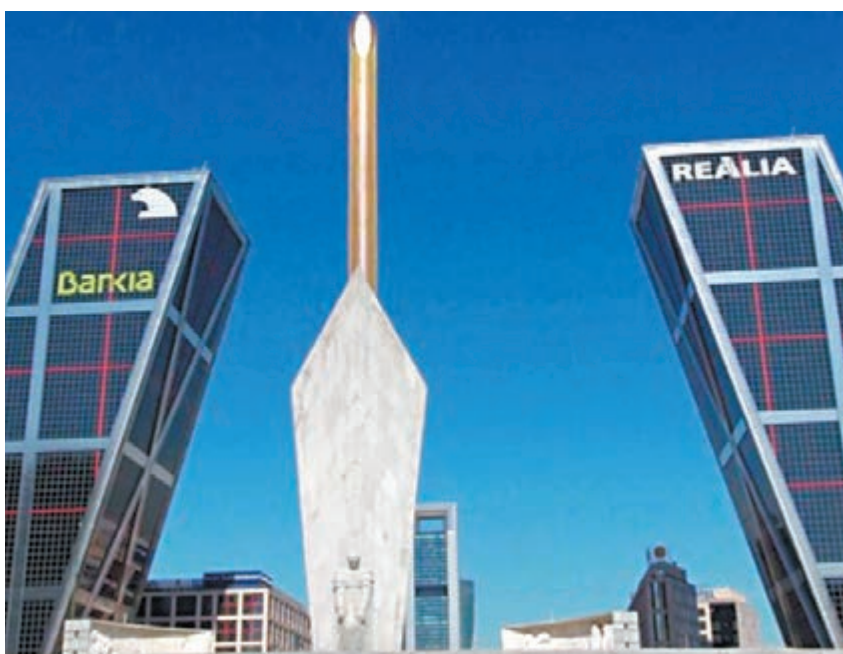
西班牙首都馬德里地標—歐洲門 (Gate of Europe)。

週四紐約4月期金收報1,372.40美元，較上日升1.90美元。烏克蘭局勢持續不明朗，再加上俄羅斯在烏克蘭邊境進行軍演，市場已頗為憂慮烏克蘭下周的局勢將可能進一步轉壞，令避險資金繼續流入金市，對金價構成支持，因此現貨金價本週五曾一度走高至1,376美元附近的半年高位。雖然現貨金價已連續3個月處於反覆攀升走勢，但烏局勢仍未有緩和傾向，限制金價回吐，預料現貨金價將反覆走高至1,390美元水平。