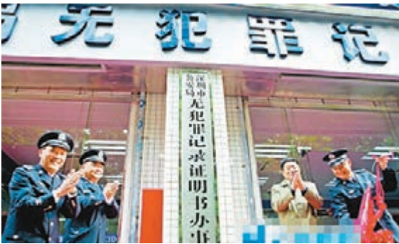
■深圳市公安局無犯罪記錄證明書辦事處正式啟用。