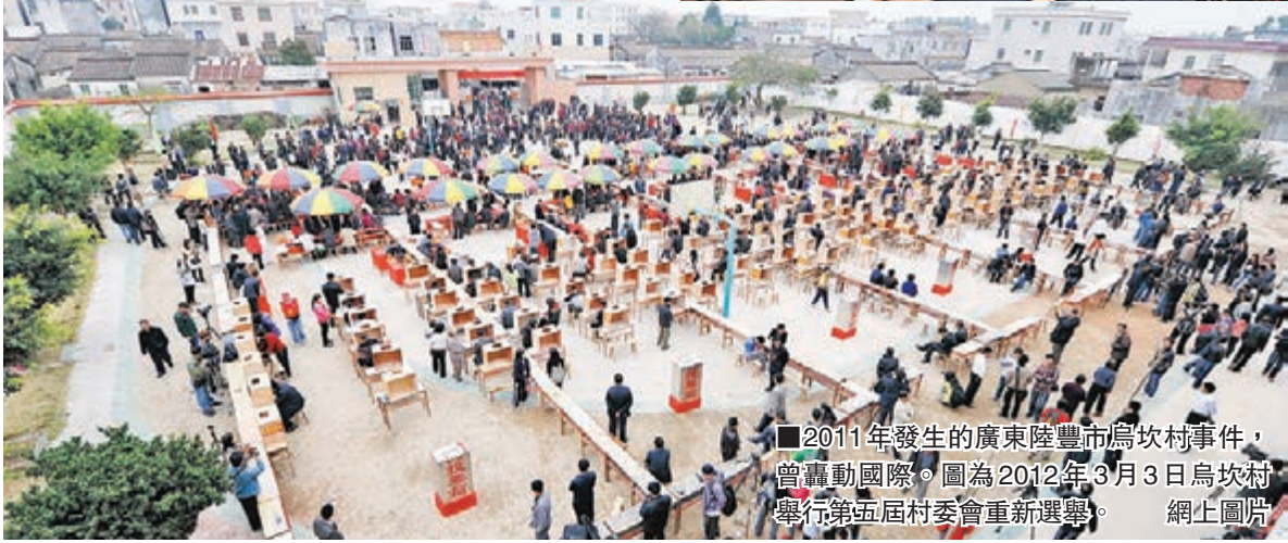
■2011年發生的廣東陸豐市烏坎村事件，曾轟動國際。圖為2012年3月3日烏坎村舉行第五屆村委會重新選舉。