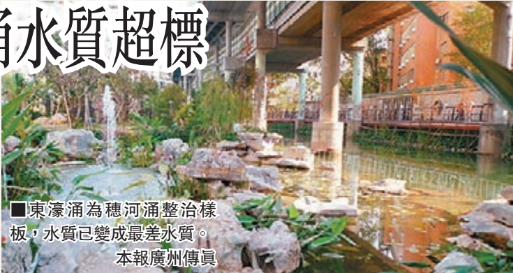
■東濠涌為穗河涌整治樣板，水質已變成最差水質。

香港文匯報訊（記者 古寧 廣州報道）廣州環保部門日前公佈了今年2月廣州市50條(54段)河涌水質監測情況，38條未達標，超標率為76%，達標河涌比上月又減少一條，而廣州市重點整治的東濠涌也因氨氮超標繼續被列在劣V類。