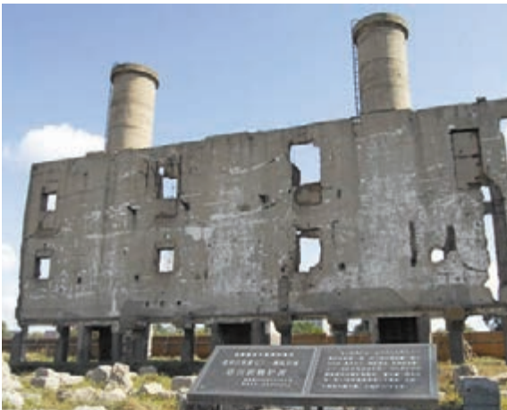
■侵華日軍第七三一部隊舊址擬申遺。 本報北京傳真

在公開的預定行程上，米歇爾將和自己的母親以及兩個女兒，參觀中國重要的歷史文化景點和北京、成都的兩所學校。可以說，一切都跟教育沾邊，一切也都跟米歇爾的公關形象沾邊。