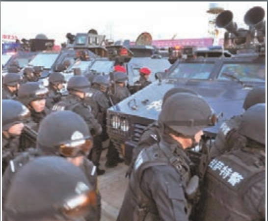
■西藏拉薩組織公安、武警、消防等部門13日在市區開展了一次大規模的維穩應急拉動演練。 網上圖片