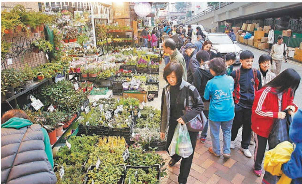
政府就「加強處理店舖阻街」徵詢公眾，擬引入定額罰款。圖為店舖非法擴充營業範圍，把貨品放至周邊公眾地方。

香港文匯報訊(記者 聶曉輝) 香港租金昂貴、小商戶經營困難，不少店舖都會將營業範圍非法擴充至周邊公眾地方，阻街情況嚴重。縱然港府近年致力打擊相關問題，店舖阻街情況非但未改善，更有蔓延之勢。民政事務局長楊立門指出，鑑於現行法例的阻嚇性不大，且檢控需時，建議以定額罰款對付違例阻街活動，例如參考亂拋垃圾的1,500元罰款，但金額未定。他又不排除將來可以連續提出票控罰款，加強阻嚇力。民政總署昨日發表諮詢文件，就加強處理店舖阻街問題展開為期4個月的公眾諮詢，諮詢期至7月14日。