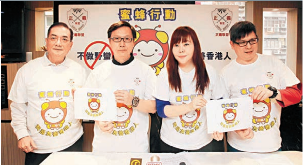
「正義聯盟」宣布開展「蜜蜂行動」,約10名成員將於周日派發襟章和單張,呼籲市民「做個友善香港人」。

她續說,過去個半月來,「驅蝗行動」、「拉籠行動」和自稱「愛國愛黨」人士,在鬧市舉行集會並進行激烈行為,用意均為反對個人遊客來港購物和觀光。