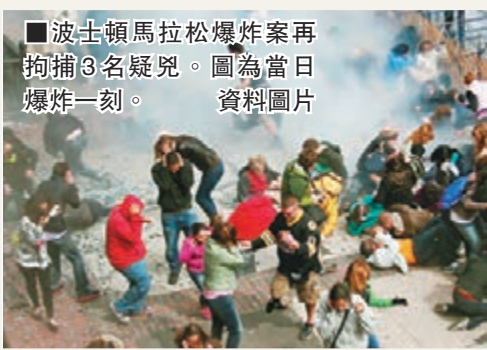
■波士頓馬拉松爆炸案再拘捕3名疑兇。圖為當日爆炸一刻。資料圖片

目前，內地已形成了以憲法、刑法為主的反恐怖主義立法體系。但有意見指，依照反恐怖主義國際公約的原則和要求，內地反恐怖主義立法仍存在不少不足的地方。譬如，內地現在只在一些部門法和國際條約的個別條款涉及對反恐怖主義的規定，並沒有一部專門、系統的反恐法。