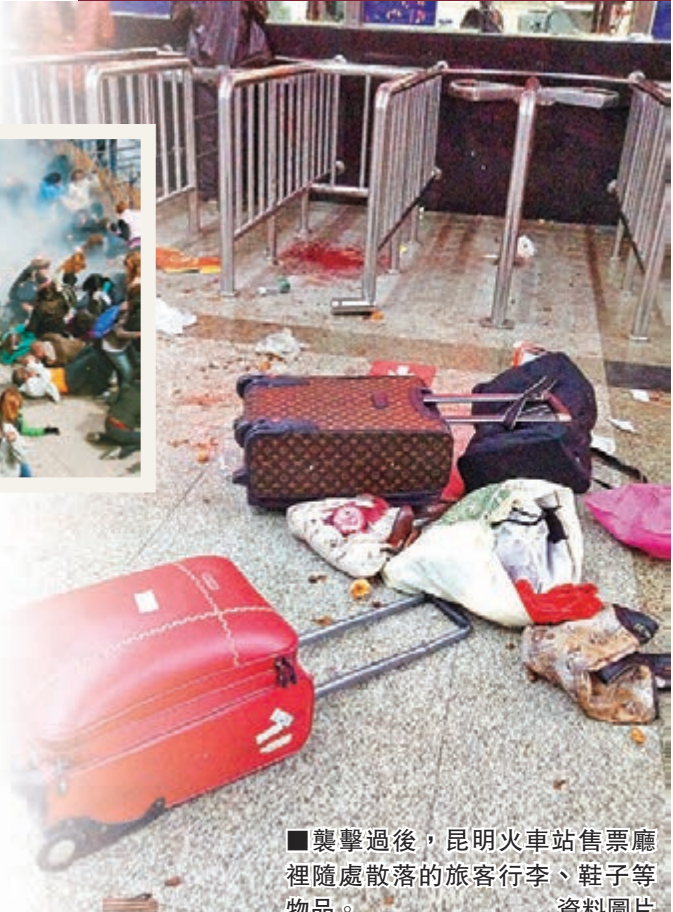
■襲擊過後，昆明火車站售票廳裡隨處散落的旅客行李、鞋子等物品。資料圖片