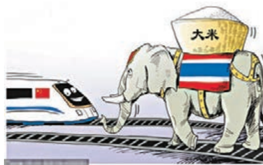
「大米換高鐵」漫畫。

香港文匯報訊 據路透社及財新網報道，泰國憲法法院前日裁定，一項2.5億泰銖(約合620億美元)政府基礎建設計劃借款案違法違憲。這意味着中國政府與泰國的農產品換高鐵路項目合作可能隨之擱淺。