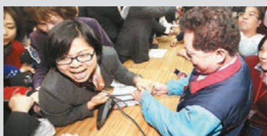
「立委」間再為爭奪麥克風起衝突。

香港文匯報訊 據中通社報道，台「立法院」聯席委員會昨日繼續初審兩岸服務貿易協議，但藍綠陣前昨日為搶發言順序濺血會場後，昨日繼續爆發肢體衝突，令議事停擺。面對「立法院」亂況，大陸多位台商會長一致表示憂心，呼籲反對黨不要再拖下去，否則只會害了台灣民眾。輿論則呼籲藍綠冷靜，停止「立法院」鬧劇。