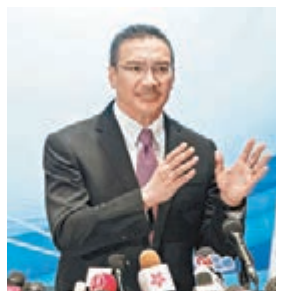
希沙姆丁為馬航「失聯後續飛4小時」解畫。

另據馬航高層代表昨日下午在北京表示，軍用雷達顯示飛機失去聯繫時的經緯度北緯0537.5，東經09857.5。這個坐標位置在馬六甲海峽，和飛機本應飛行的方向相反。民航局稱，這是軍方信息，如有需要他們可以申請派軍方代表。