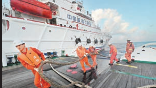
參與搜救的南海救101輪上的隊員拖拽纜繩。

另外，中國海上搜救中心昨日稱，中方8艘艦船（共載5架直升機）正在馬航失蹤客機疑似現場展開搜尋。截至昨日中午，中方搜救力量已在事發海域連續搜尋100個小時，累計搜尋45,763平方公