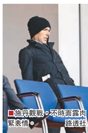
施丹觀戰，不時面露肉緊表情。