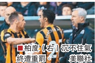
柏度(右)沉不住氣終遭重罰。

本月對侯城時用頭頂對方球員的紐卡素領隊柏度，被罰禁賽7場，並被罰款6萬英鎊。這是1992年英超聯創立以來，英足總給予領隊最長的停賽處罰。