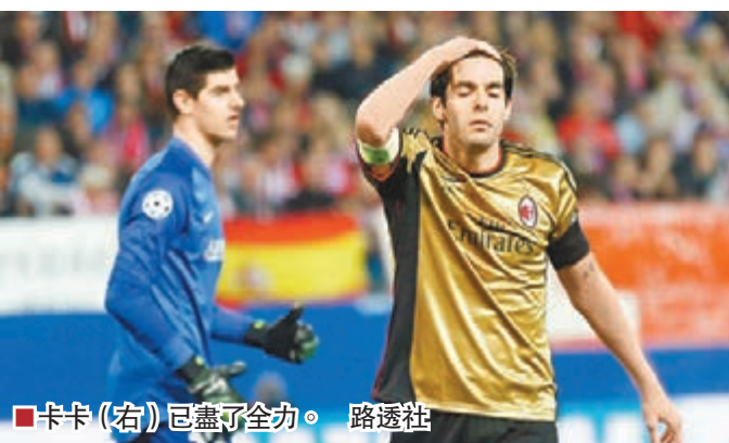
卡卡(右)已盡了全力。