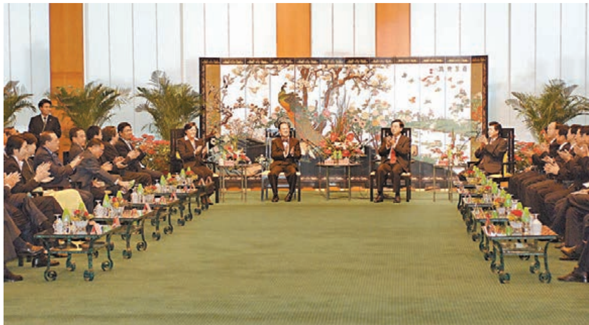
2005年，當時特首曾蔭權率立法會議員訪粵，與當時廣東省委書記、現時全國人大委員長張德江在廣州白鵝賓館會面。