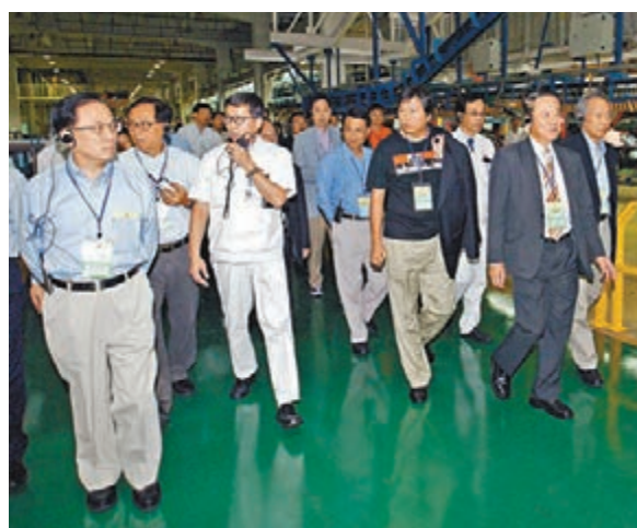
當時特首曾蔭權(左)帶領立法會議員到廣州本田汽車廠參觀車輛生產過程。

到珠江三角洲展開為期2日的訪問，先後到訪深圳、東莞、廣州和中山等地。曾蔭權自任團長，時任立法會主席范徐麗泰則擔任副團長，團員包括時任財經事務及庫務局局長馬時亨、工商及科技局局长曾俊華，以及59名立法會議員。