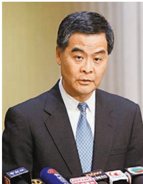
梁振英宣布，將在下月中旬安排全體立法會議員到上海交流。

另外，「港人講地」網站昨日引述消息表示，是次訪問「說不定」有中央領導到上海，趁機與眾立法會議員會面。