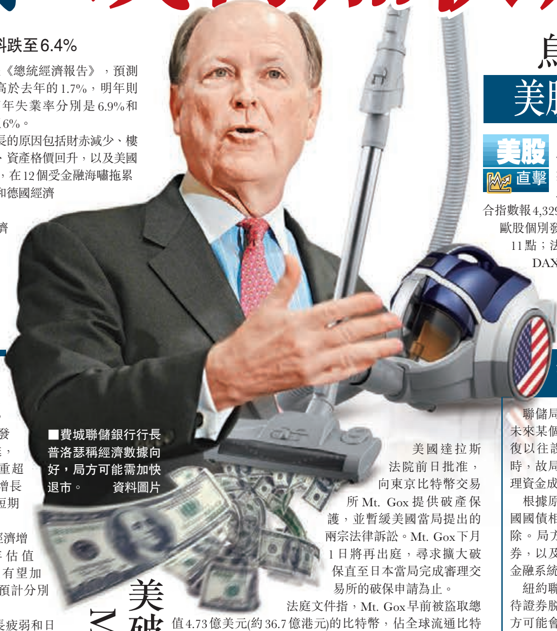
費城聯儲銀行行長普洛瑟稱經濟數據向好，局方可能需加快退市。資料圖片

然而報告提到，即使經濟形勢整體向好，但中等收入家庭從目前股市獲益甚少；房地產價格仍低於危機前水準，限制了中等收入群體的財富效應。■《華爾街日報》/路透社/美聯社