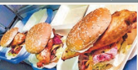
號稱全英最辣的漢堡包。

英國布賴頓一家餐廳推出號稱全英最辣的漢堡包，吸引大批嗜辣食客挑戰。餐廳規定購買挑戰者須年滿18歲，並簽署類似「生死狀」的免責聲明。由於漢堡包實在太辣，至今已5名食客不適送院，非常失威。勁辣漢堡售3.9英鎊(約50港元)，按分辨各種辣度的「史高維爾指數」計算，漢堡的麻辣指數達920萬，是普通辣椒的1.8萬倍，堪稱「地獄漢堡」。3,000名挑戰者只有59人成功吃完，5名失敗食客分別因腸穿洞和懷疑過敏，須送院治療。■《每日郵報》