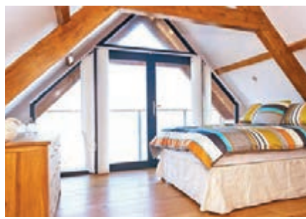
度假屋一應俱全，有睡房等設施。網上圖片