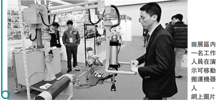
展區內一名工作人員在演示可移動搬運機器人。

香港文匯報訊(記者 李欣 天津報導)第十屆中國(天津)國際裝備製造業博覽會IEME2014(以下簡稱「製博會」)已於3月6日—9日在津舉行,全球20多個國家和地區的1200多家知名企業將參展。本屆「製博會」展出面積突破80,000平方米,專業觀眾預計突破80,000人次。哈斯、歐姆龍、雅馬哈、韓國現代威亞、台灣友佳、台灣程泰、香港寶力等內外知名企業悉數到場,形成了以機床、工業自動化、機器人、鑄造、齒輪、動力傳動、鉗業及天津市重大裝備製造為中心的8個專業展覽區域,精細展示目前國際工業生產領域的高端設備和前沿技術。