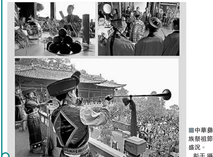
中華彝族祭祖節盛況。

香港文匯報訊(記者 李麗娟 巍山報導)今年中華彝族祭祖節暨第四屆中國大理巍山小吃節日前在雲南南詔古都大理巍山啟幕,來自內地的廣大彝胞來到巍山巍山的南詔彝族土廟祭拜共同的祖先。同時開幕的第四屆中國大理巍山小吃節,共設有210多個攤位,可以吃到逾百種特色小吃。今年的小吃節還能品嚐到來自內地近50餘種特色小吃。