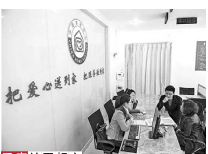
蘭陵文化專項基金

香港文匯報訊(記者 于永傑 山東報導)由中國孔子基金會和山東省蘭陵縣政府共同設立的「蘭陵文化專項基金」在濟南啟動,這是中國孔子基金會專為研究、挖掘蘭陵地方文化而設立的首項專項基金。今年初,經民政部批覆,山東蒼山縣更名蘭陵縣。據悉,蘭陵縣是山東境內古代最早設立縣治的地方,被譽為「山東第一縣」。儒家代表人物荀子曾兩度出任蘭陵令,並在這裡形成和傳播了其學術思想。