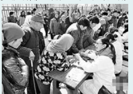
甘肅省今年將推多項醫療改革,圖為甘肅蘭西縣舉辦義診活動。

甘肅今年將以新增的21個縣級公立醫院作為改革試點縣,逐步建立和完善現代醫院管理制度。推進醫療服務價格改革,提高技術服務價格,嚴格控制醫療費用的不合理增長,積極推進全科醫生與居民契約服務,健全城市醫院對口支援縣級醫院的長期合作幫扶機制,力爭將縣城內患者向上轉出率控制在10%以內。同時甘肅將在今年建立醫療機構藥品不良反應監測通報督查制度,定期開展聯合檢查。