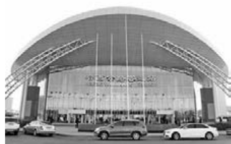
剛投用的哈西公路客運站。

更為便利的是,哈西客運站與哈西火車站比鄰,位於哈西客運站地下二層的旅客換乘專用通道,僅需步行六七分鐘,旅客便可毫無障礙地通往哈西火車站地下,實現公鐵「零換乘」。據悉,隨着哈西地區公交線路、地鐵等交通方式的不斷建設完