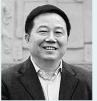
全國人大代表、銅陵市書記宋國權。

宋國權表示,推進科技創新,要圍繞構建現代產業體系,促進科技與經濟緊密結合,產業鏈與技術鏈深度融合。據介紹,截至去年底銅陵市擁有高新技術企業數達到101家。而去年該市戰略性新興產業實現產值482.7億元,增長20.6%。