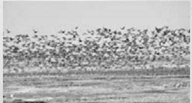
吉林琿春敬信濕地,候鳥成群。

目前,吉林省西部地區重要濕地生態補水长效机制已基本建立,使退化濕地得到恢復。依賴濕地生存的613種濕地植物和297種濕地野生動物得到有效保護。符合鳥類覓食條件的棲息地面積明顯增加,有效保護了亞洲東部候鳥遷徙的重要停歇地,提升了中國在國際保護瀕危鳥類中的重要地位。莫莫格保護區白鶴停歇時間和種群數量都堪稱世界之最,成為全世界最大的白鶴遷徙停歇地。