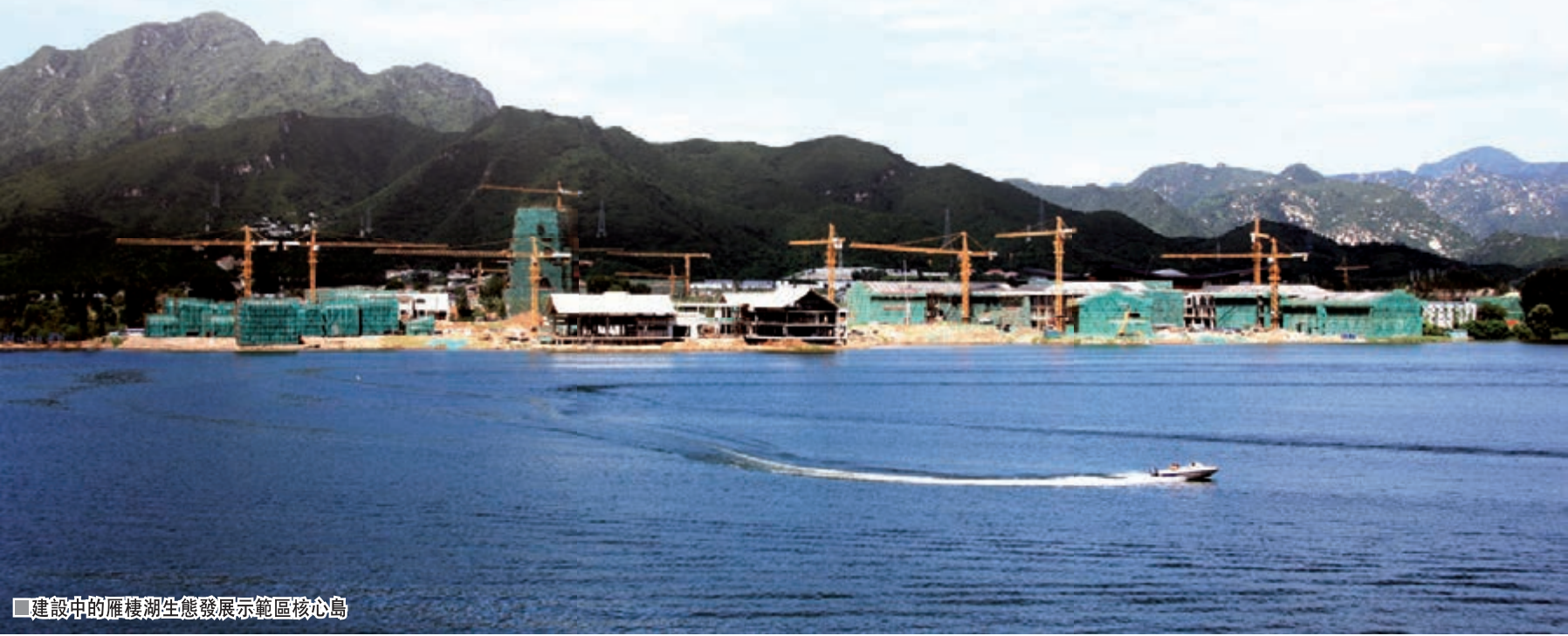
■建設中的雁棲湖生態發展示範區核心島

五是生態建設再上新台階。近年來完成平原造林2.1萬畝，栽植各類苗木144萬株，實施了懷九河、雁棲河等29條河道綜合整治，治理水土流失面積499平方公里。同時，隨着北京懷柔醫院、城鄉一體化學校、懷北九年一貫制學校等一批公共服務設施項目順利實施，商業服務能力加速提高，宜居宜業的城市功能日益完善。