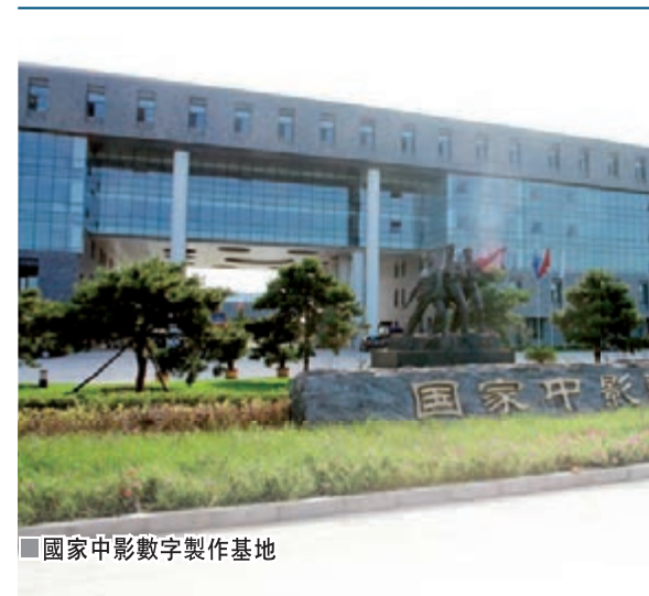
■國家中影數字製作基地

近年來，常到懷柔的人會發現，懷柔區的變化很大。其中，2013年的變化亦令人矚目。據懷柔區領導介紹，一年來，懷柔區有四大方面的明顯特點：一是經濟發展穩健向好，二是城鄉面貌顯著改善，三是雁棲湖生態發展示範區建設快速推進，四是民生事業全面加強。全年地區生產總值突破200億元，增長10%；完成地方公共財政預算收入26.5億元，增長13%；固定資產投資155億元，增長12%；城鎮居民人均可支配收入32,518元，增長10%；農民人均純收入16,189元，增長11%，主要經濟指標均實現了兩位數增長。文化科技高端產業新區建設，步伐不斷加快、格局更加清晰。2013年新認定高新技術企業14家，總量達到84家，實現技工貿總收入129.6億元，同比增長17.1%，位居生態涵養發展區首位。同時，還引進華信集團（北京）總部基地建設、統實飲品資產重組等投資億元以上項目20個，計劃總投資達65.99億元。