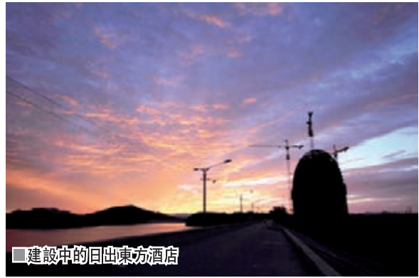
■建設中的回出東方酒店

三年來近半數票房過億國產大片都出自以懷柔區楊宋鎮為核心區的中國（懷柔）影視基地。目前，懷柔全區已累計引進影視產業重大功能性項目16個，累計完成投資超過47億元，註冊影視企業數量達到360家，累計拍攝製作影視作品1,500餘部。2013年，在影視城舉辦的北京電視節目交易會，吸引了600多部電視劇、動畫片、紀錄片參展。懷柔作為「中國影都」的城市品牌形