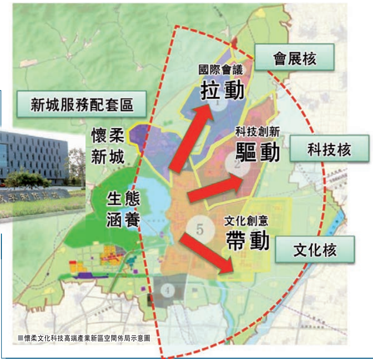
■懷柔文化科技高端產業新區空間佈局示意圖