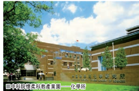
■中科院懷柔科教產業園——化學所