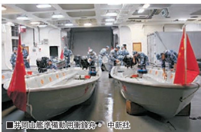
井岡山艦準備動用衝鋒舟。