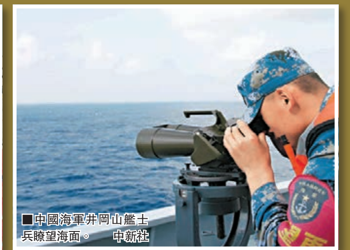
中國海軍井岡山艦士兵瞭望海面。中新社