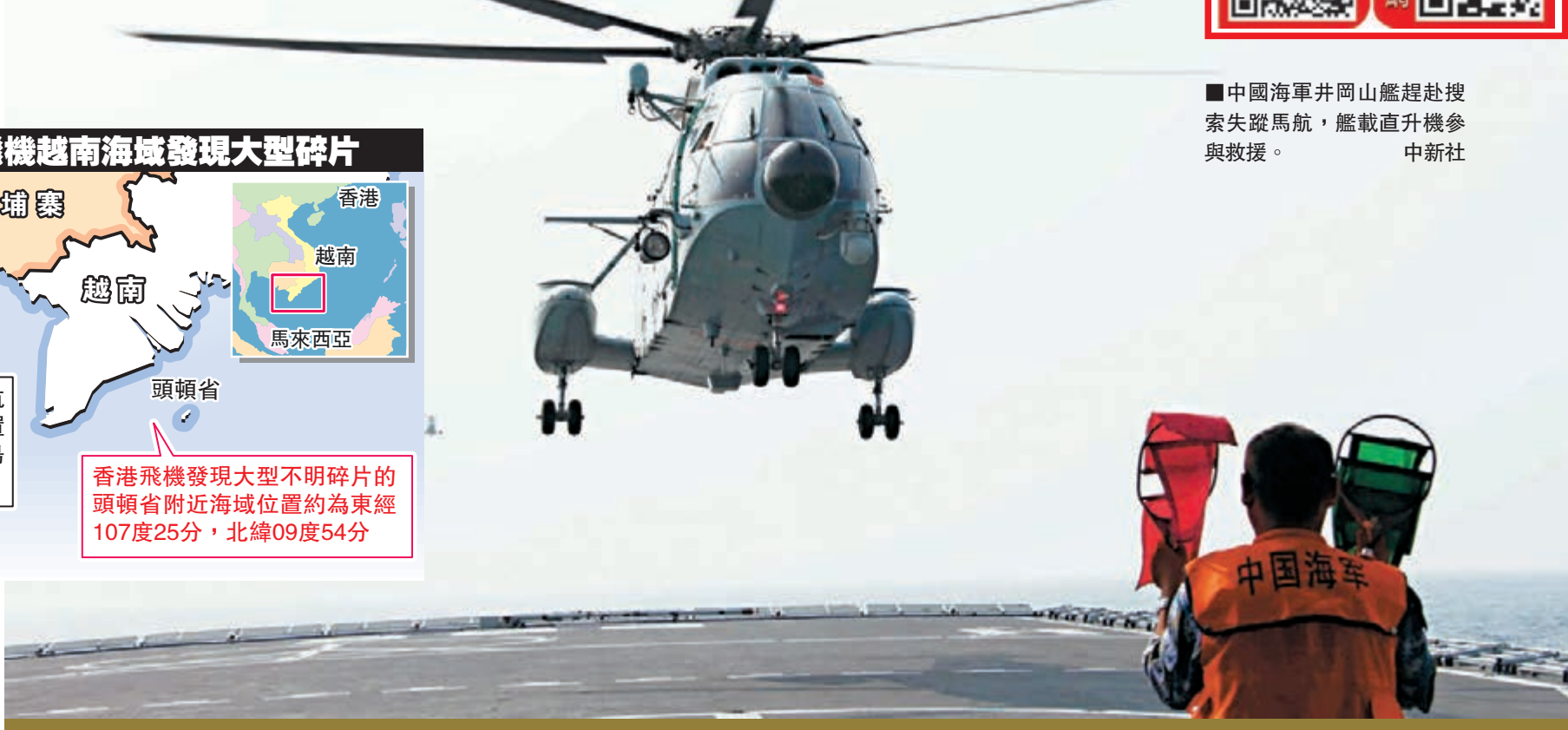
中國海軍井岡山艦趕赴搜索失蹤馬航，艦載直升機參與救援。

針對此次馬航客機失聯時間長、搜尋面積大的實際需要，中國西安衛星測控中心啟動衛星測控應急預案，對在軌運行衛星測控計劃進行調整。緊急調動海洋、風雲、高分、遙感等4個型號，約10顆衛星為地面搜救行動提供技術支持。其中部分衛星停止了原有工作計劃，清空星上原有指令，全力投入搜救任務。同時，加強對北斗導航衛星的狀態監控。科技人員也實行24小時輪班監控。