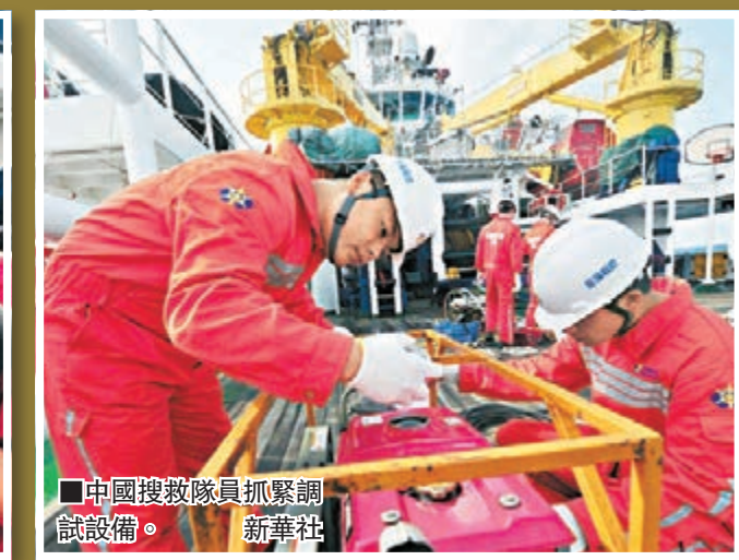
中國搜救隊員抓緊調試設備。