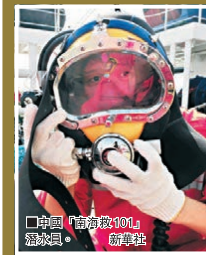
中國「南海救101」潛水員。