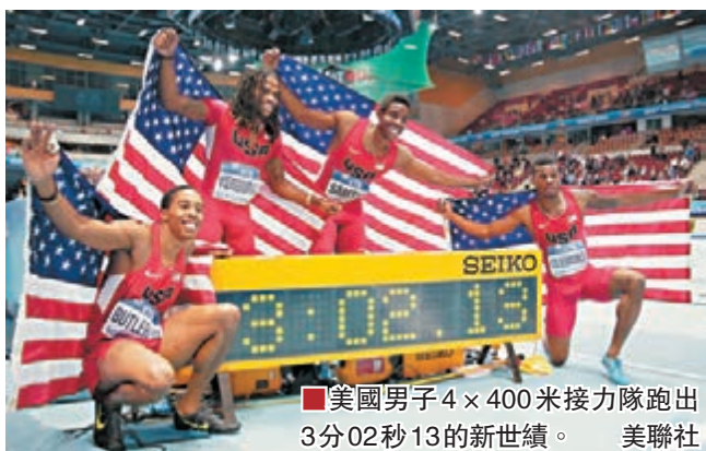
美國男子4x400米接力隊跑出3分02秒13的新世績。