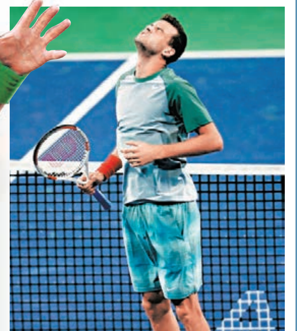
迪米杜夫被祖高域的問題考起？