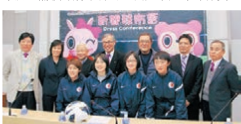
女子國際青年足球邀請賽將由下月18日展開。

香港文匯報訊(記者 郭正謙)「和富女子國際青年足球邀請賽」將由4月18日至20日一連三天假荃灣城門谷運動場舉行，港隊今屆將派出14歲以下代表出戰，香港足總主席梁孔德認為今次賽事是難得機會，與鄰近國家切磋球技，備戰即將舉行的亞洲女子足球錦標賽。