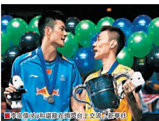
李宗偉(右)和諶龍在頒獎台上交流。

2014年全英羽毛球公開賽周日結束，中國隊贏得女單和女雙冠軍，但在男單決賽中，上屆冠軍諶龍以總局數0:2負於馬來西亞將李宗偉，衛冕失敗。女單決賽在中國2位前冠軍之間進行，最後2011年冠軍王適嫻以21:19和21:18力挫2012年冠軍李雪芮，第2次贏得賽事女單冠軍。女雙方面，于洋/王曉理以21:9和21:14輕取隊友馬晉/唐淵婷，3度在全英賽揚威。王適嫻賽後