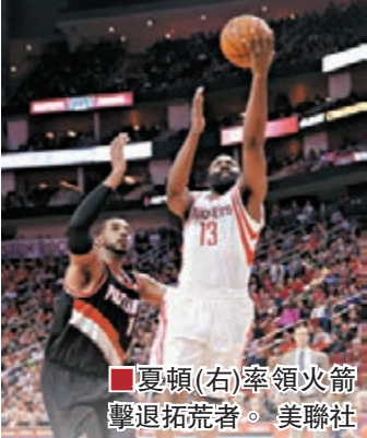
夏頓(右)率領火箭擊退拓荒者。