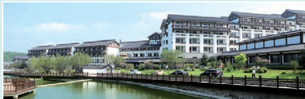
■大連東泉假日酒店。

大連東泉假日酒店坐落於風景秀麗、氣候宜人的普灣新區——小黑山風景區。總建築面積13萬平方米，目前完成投資9億元。酒店似江南小鎮的萬般閒暇、詩情畫意。酒店擁有舒適典雅、裝飾精良的標準房、豪華房、商務套房等300餘間。擁有清新、優雅的中、西、日餐廳，時尚的餐飲包房、大堂吧。時尚、健康、舒適、愜意的溫泉SPA中心，匯集養生、休閒、理療等多種功能，是中國北方最具特色的溫泉文化主題酒店之一。