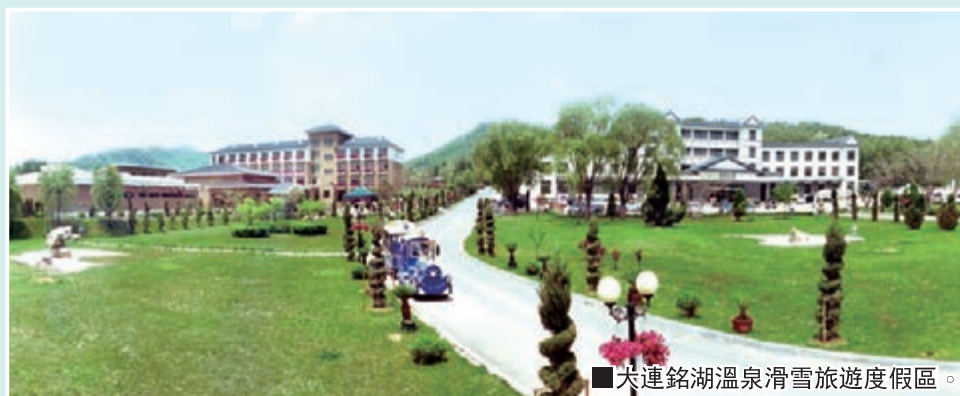
■大連銘湖溫泉滑雪旅遊度假區。

大連銘湖國際溫泉滑雪度假區是按五星級標準興建的以運動為主題，以溫泉、滑雪為依托，集休閒、度假、會議、商務、旅遊於一體的綜合性旅遊度假區。其中三期工程總投資1.8億元，以「壺中天地」為理念，建有日式溫泉會館、日式庭院、公共野浴溫泉花園、溫泉會館、日式庭院公共野浴區、IP溫泉客房和餐廳等設施。