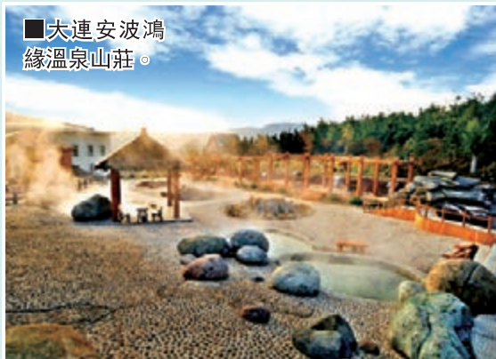
■大連安波鴻緣溫泉山莊。

大連安波鴻緣溫泉山莊位於國家AAA級旅遊區——大連普蘭店市安波溫泉旅遊度假區，距安波鎮中心1.5公里。山莊佔地40萬平方米，建築面積4萬平方米，是以溫泉為主題，按准五星級標準興建的集溫泉養生、商務接待、特色餐飲、生態旅遊、保健娛樂及大小型會議沙龍為一體的度假酒店。該山莊建築風格定位為「鄉村歐陸風情」。目前，該酒店為大連地區溫泉賓館中設施最先進、功能最齊全、環境最優美的特色旅遊地。