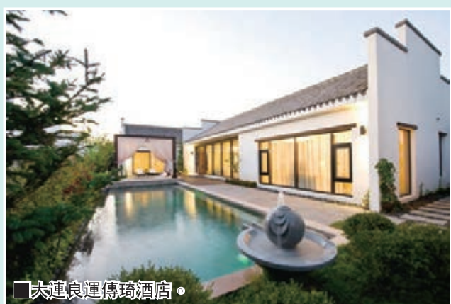
■大連良運傳琦酒店。

良運·世外儉湯是由良運集團以「溫泉度假居住體驗」為核心理念營造的一處溫泉度假小鎮。其中大連良運傳琦溫泉精品酒店項目位於大連市安波鎮北部的儉湯鄉境內。地塊坐享原鄉幽靜山谷村落，緩緩流淌的儉湯河，孕育千年的天然自湧暖湯……構成一幅超然世外的田園聖景。精品酒店總建築面積16422平方米；庭院式溫泉度假別墅43棟，酒店會所1棟，包括特色餐廳、SPA會所、模擬高爾夫、壁球館等。已於2013年10月1日正式營業。