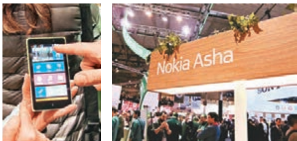
Nokia X 系列的手機除了使用 Android 外, 還具備雙卡功能。

至於品牌今次這樣做的原因, Aaron 估計是品牌想吸引用家習慣使用他們的手機, 從而日後升級至較強的 Windows Phone 手機。不過, 這種做法或許很危險, 因為用家