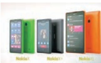
Nokia X 系列三部機放在一起時的比較。

X 系列使用的雖然是 Android, 但當中就沒有 Google Play Store。用家要安裝 Google Android apps, 就必須使用品牌自家的 Ovi Store, 但相信問題不大, 因為 Android 發展已有一段時間, 相信 Ovi Store 很快就會有大量的 Apps 下載。