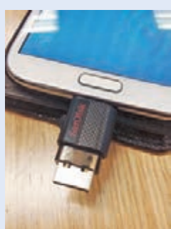
只要將 SanDisk Ultra 雙用隨身碟插在 Android 手機的 USB 位, 應用程式就自動啟動。

現時的智能手機配備強大的鏡頭, 而且可以隨時隨地使用, 因而成為拍攝及攝錄生活中珍貴時刻的主要工具。在很多情況下, 我們會遇到這些問題: 如何從流動裝置下載有關檔案以進行備份、與人分享或騰出智能手機空間以儲存更多相片、影片及其他檔案。最近筆者發現如果你是 Android 手機用家, 只要有 SanDisk Ultra 雙用隨身碟, 它專為 Android 智能手機及平板電腦設計, 讓你可輕鬆、即時、無憂地把多媒體檔案移離智能手機, 並安全地儲存及騰出空間, 或簡易地在智能手機、平板電腦及電腦間傳輸相片、影片、音樂及其他檔案。與其他受歡迎的 USB 隨身碟相似, Ultra 雙用隨身碟只需要接駁至兼容 Android 智能手機的微型 USB (micro-USB) 連接埠以存取高達 64GB 的「即插即用」隨身碟儲存空間。隨身碟亦具備另一個全型 USB 2.0 (full-size USB 2.0) 連接器, 讓檔案可輕易地傳輸至個人電腦或 Mac 電腦。配合可於 Google Play 下載的 SanDisk 記憶體專屬應用程式。此應用程式讓你管理儲存於手機內置及外置記憶體的檔案, 以及管理、檢視、複製及備份雲端儲存服務。即使需要處理更多圖片、影片及音樂, 隨身碟仍是最容易騰出手機或平板電腦空間的方法。