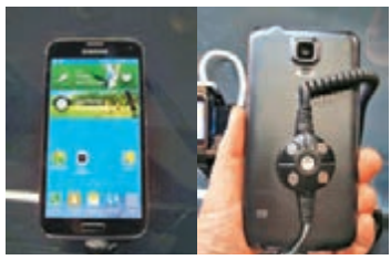
S5 的外形和上一代 S4 有點相似, 或許要再加強力宣傳了。

Aaron 認為, 品牌今次這樣做有點在追趕對手, 他覺得目前防水防塵功能, Sony 早就有類似的產品。而指紋功能, iPhone 和 HTC 亦早已推出相關產品。去年 S4 的好壞參半, 要看今年 S5 是否能再提起大家興趣了。