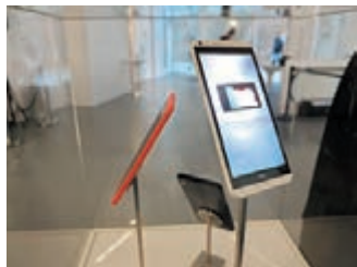
Desire 816 雖算是入門級, 但其實機身外形不算太差。

其實, Desire 816 的規格也不算太差, 使用 1.6GHz 四核處理器, 而且亦已支援 4G LTE, 螢幕亦達 5.5 吋。另外, 它還有 BoomSound 喇叭設計, 在聽歌和上網, 效果也可以很震撼。Desire 816 會由 3 月起在中國先上市。而品牌另一部旗艦機 HTC One, 已決定將在 3 月 25 日發佈。