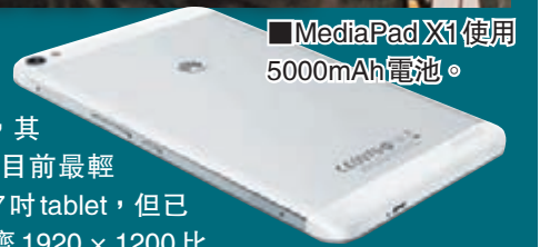
MediaPad X1 使用 5000mAh 電池。

MWC 2014 另一個重點, 就是多了不少內地的廠商參與, 例如華為和中興等都有不少新機推出。當中以華為為例, 其