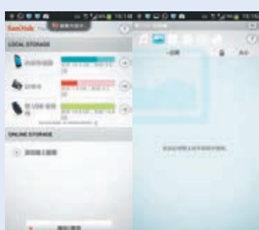
下載這應用程式, 你手機內的空間一目了然。

售價: HK$130 (16GB)、$210 (32GB) 及 $390 (64GB)