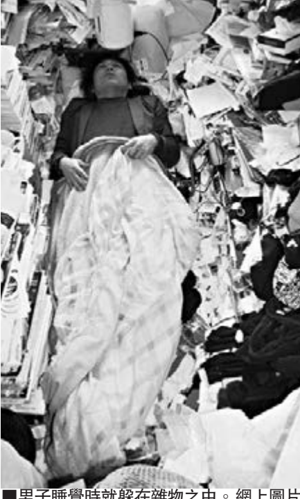
男子睡覺時就躲在雜物之中。