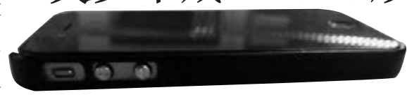
電槍看來與iPhone十分相像。