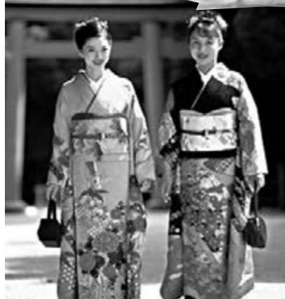
日本傳統貴族和服。