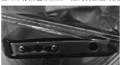
電槍頂部的銀色條有兩個圓點。

一名巴士司機早前報案稱被數名青年種族歧視，警員到場搜身，原以為搜出iPhone，沒想到在檢視期間被電擊。警官馬什表示，電槍外形像黑色iPhone，但調校音量的按鈕較凸出，頂部的銀色條有兩個圓點。