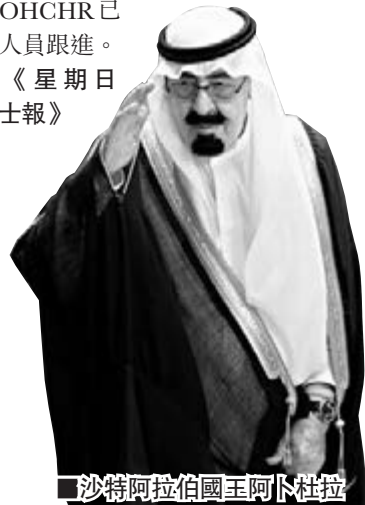
沙特阿拉伯國王阿卜杜拉