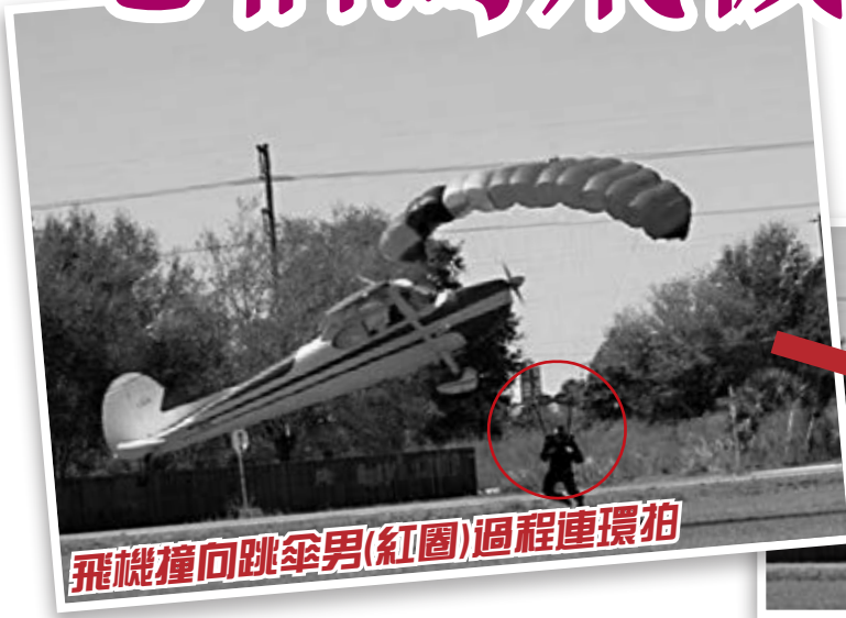
飛機撞向跳傘男(紅圈)過程連環拍