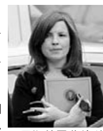
馬斯羅莫納科靠染髮遮蓋白髮。