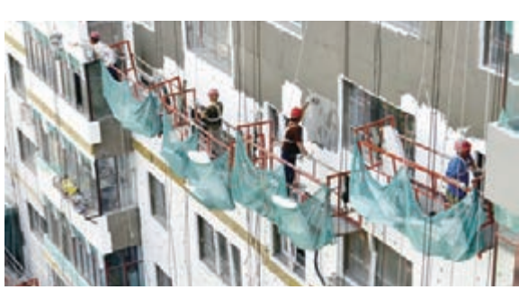
水磨溝區對老舊社區進行外牆保溫改造，確保居民過一個溫暖的冬天。

改造後的社區，居民生活環境明顯改善，公共基礎設施進一步優化升級，存在多年的建築節能、管線改造和環境整治等問題得到了有效解決。隨着烏魯木齊老舊社區改造工作的有序開展和全面推進，越來越多的老舊社區居民感受到了「幸福來敲門」的喜悅。