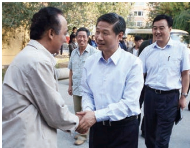
自治區黨委常委、烏魯木齊市委書記朱海倫等領導調研老舊社區改造工作，並走訪慰問社區群眾。