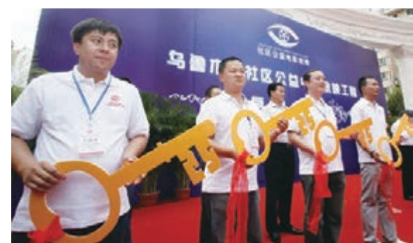
社區公益電影放映啟動儀式副本。