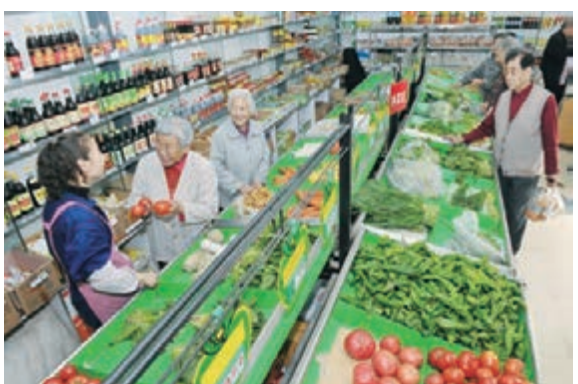
居民在便宜便捷的便民蔬菜直銷點購物。

截至目前，烏魯木齊市政府對社區蔬菜肉食品直銷點的建設投入已經超過1.17億元。全市722個社區中