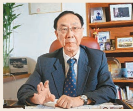
簡松年建議,內地可引入以繳付地租換取土地使用權續期的形式。資料圖片

香港文匯報訊(兩會報道組 林舒婕)隨着樓齡增高,內地商品房使用年限的困擾日益浮現,對業主自住、養老、房地產業和金融業均帶來不明朗因素。律師出身的全國政協港澳委員簡松年提出,內地可參考香港經驗,盡快完善土地使用續期的法律法規,並推出切實可行的政策,解決土地使用權和房屋所有權在期限上的衝突問題。